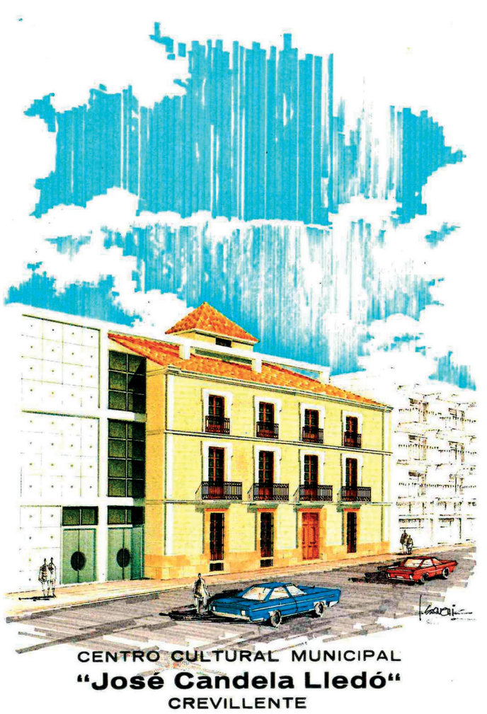
AMCR, Postales de la Casa Municipal de Cultura , s.f. Sig. 8478/4.