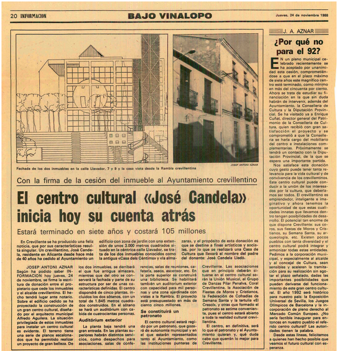
AMCR, Recortes de prensa , 1988, Sig. 8478/4.

quilados o cedidos por el Ayuntamiento que, ya en 1959, comenzó a sopesar la idea de construir un edificio destinado a Casa de Cultura Municipal, en aquel momento proyectado en el edificio situado en la Plaza de la Constitución, número 11 (actual Casal Festero).