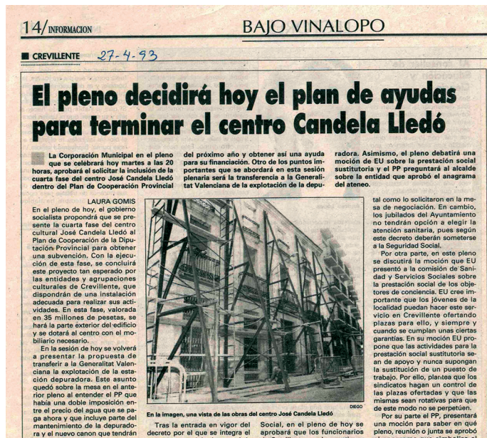
AMCR, Recorte de prensa, 1993, Sig. 8478/4.

recidos), que permaneció apuntalada y la calle cortada al tráfico, hasta que finalmente, en mayo de 1992, el Consejo Rector del Centro Cultural acordó su derribo y posterior reproducción, tras haber invertido un millón de pesetas en los trabajos de apuntalamiento.