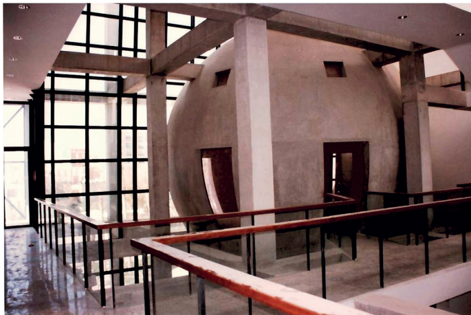
Proceso de construcción de la Casa Municipal de Cultura, 1996, Sig. 5869/1.

La actividad cultural crevillentina venía desarrollándose en casas particulares, teatros construidos por iniciativa privada o bien, inmuebles al-