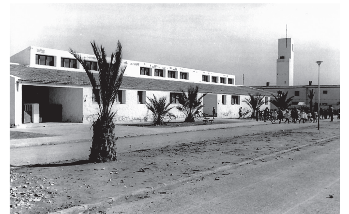
Archivo Municipal de Crevillent (AMCR), Colegio público San Luís Gonzaga (El Realengo), s.f., Sig. 9305/40.

y servicios, a saber, Casa Consistorial, Cooperativa Agrícola, Casa del Médico o dispensario con dos viviendas, iglesia y dependencias parroquiales y las viviendas, quedando al margen las escuelas, que contaban también con tres viviendas para maestros.