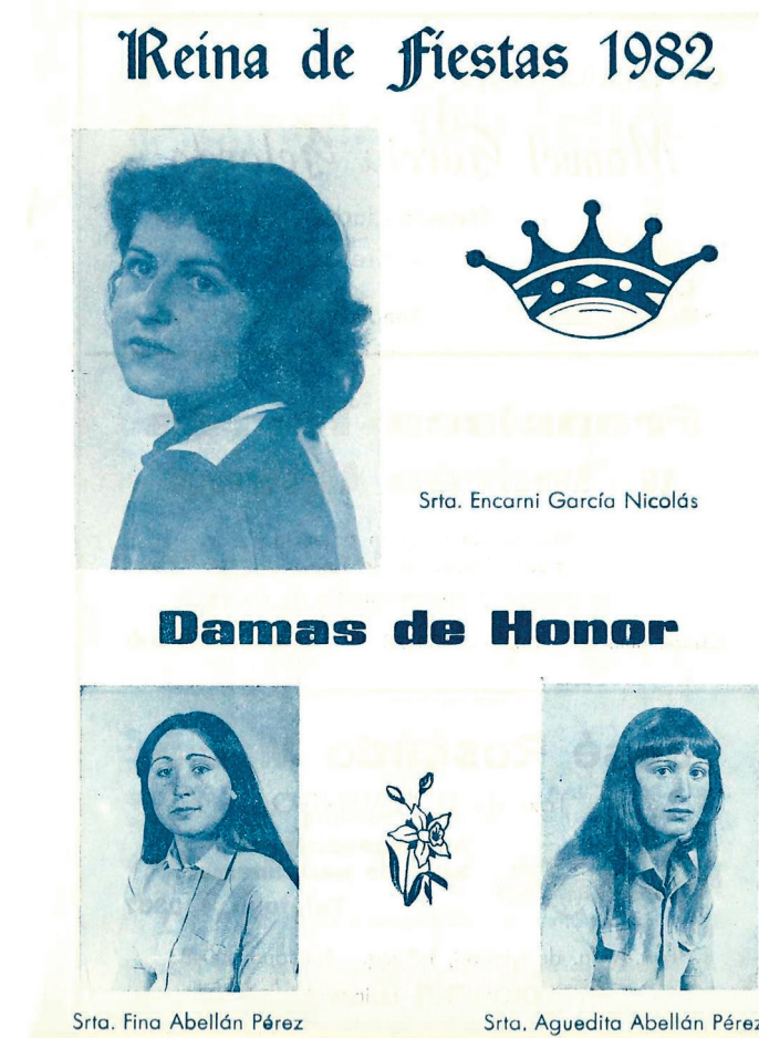
AMCR, Fondo Joaquín Pérez Galipienso, Programa de fiestas del Realengo, 1982, Sig. 10/8.

nimiento del alumbrado y agua potable, mantenimiento de escuelas, servicio de vigilancia de la Policía Local, así como los gastos de un Club Recreativo y de las fiestas celebradas en honor a San Luís Gonzaga, mediante un documento que se conserva en el Archivo Municipal con la firma de todos los solicitantes, petición que fue aceptada por el pleno, con fecha 25 de julio de 1962.