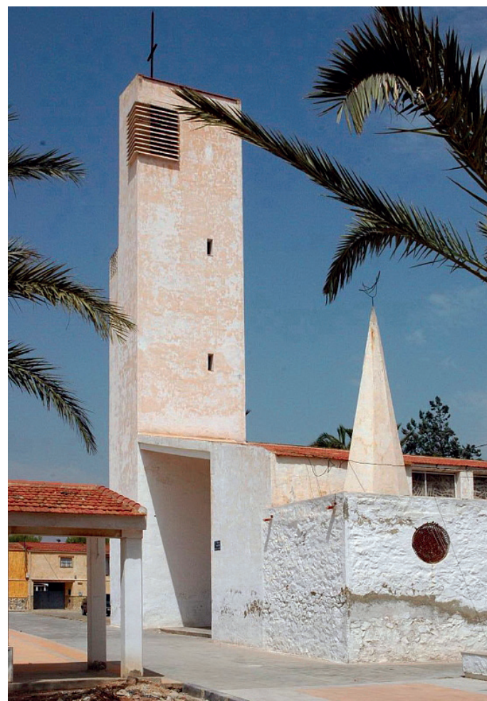
Vista exterior Iglesia El Realengo