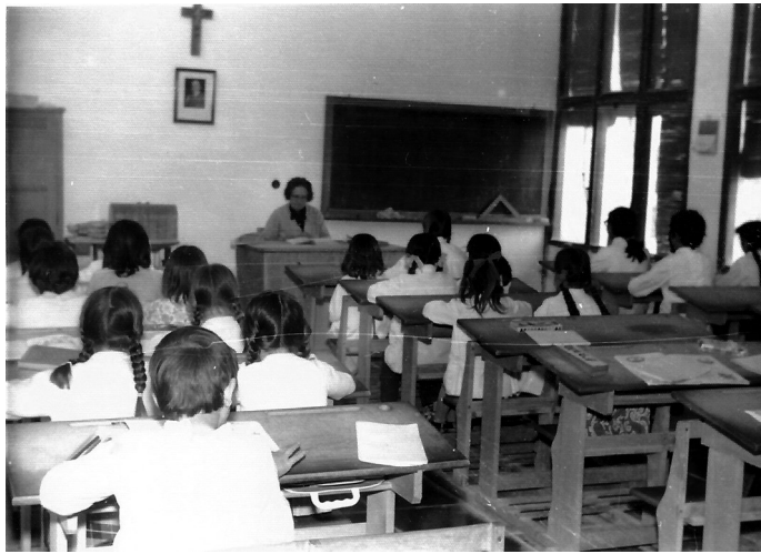
AMCR, Colegio público San Luís Gonzaga (El Realengo), 1972, Sig. 3755/2.

ceso a la misma. En la fachada principal sobre el muro flanqueado por las puertas de acceso se instaló el mural de la Anunciación, obra de Manuel Baeza y Adrián Carrillo, con materiales cerámicos, sobre los que se añade la escultura de bulto redondo de la Virgen.