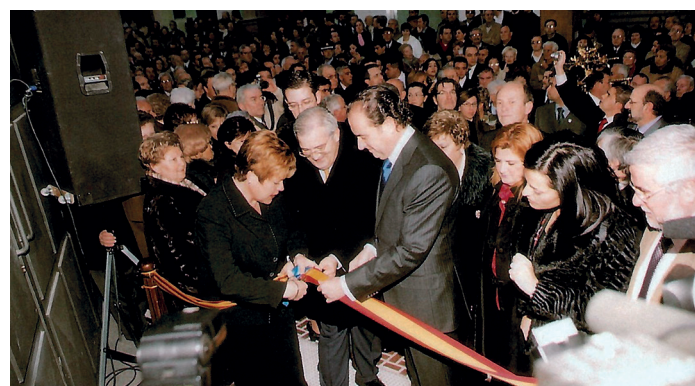
Inauguración MUSS, 19 de febrero 2005.