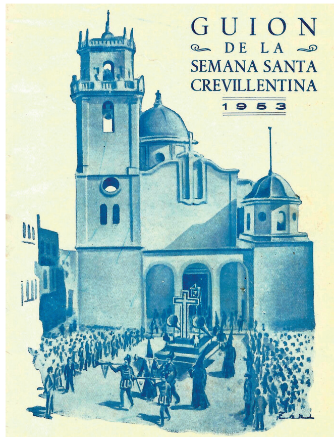
AMCR, Fondo José Serna Soler, Programa Semana Santa, 1953, Sig. 1/20.

Tras la contienda civil, la imaginería se completó con las tallas de Mariano Benlliure, así como de otros artistas como García Yúdez, Carmelo Vicent, Navas Parejo o Juan García Talens, entre otros, grupos escultóricos que estaban depositados también en las empresas textiles locales, donde se realizaba el arreglo de pasos previo a las procesiones, aunque no siempre en las mejores condiciones.