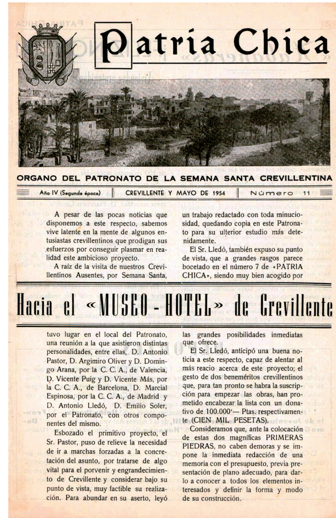
AMCR, Hemeroteca, Fondo Joaquín Galiano García, Patria Chica, 1954, Sig. 4/3.

Desde el siglo XIX, la Semana Santa crevillentina contaba con fama nacional, sin embargo el principal problema era la falta de alojamiento para los turistas y de hecho, cuando venía alguna personalidad, eran las familias más pudientes las que ofrecían su vivienda particular.