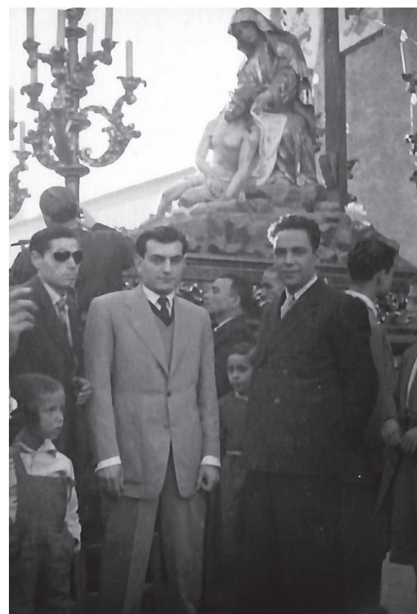
Foto familiar Semana Santa, 1944, Sig. 2/10.