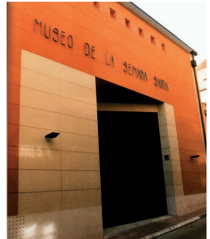
Fachada Museo Semana Santa.

El proyecto del MUSS estuvo a cargo de los arquitectos crevillentinos Enrique Manchón Ruiz y José Antonio Maciá Ruiz, construido sobre un solar de 407,50 m 2 , consta de una planta sótano, planta baja y cuatro plantas piso, con fachada a las calles Corazón de Jesús y San Cayetano, y una superficie total construida de 1.655,90 m 2 y un coste presupuestado de 129.095.014 pesetas (775.876,66 €).