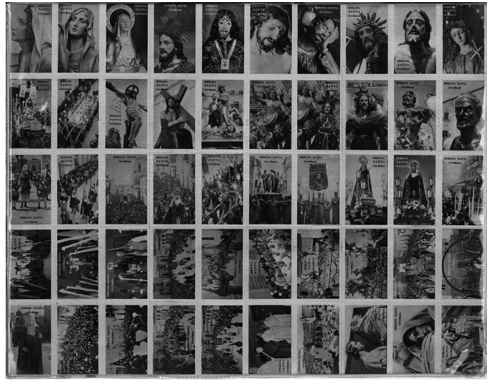
AMCR, Sellos Semana Santa, 1948.

correspondientes cofradías, aunque muy pocas han conservado documentación de esta época, como el caso de La Samaritana.