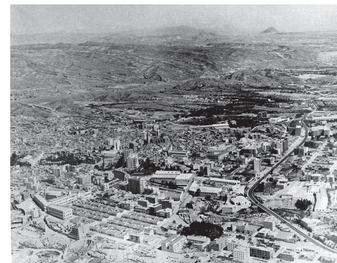
Fotografías aéreas de la calle Reverendo Pascual Martínez con restos del Cementerio Viejo (1976).