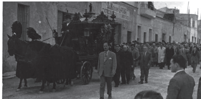
Fotos de traslado de fallecidos hasta el Cementerio Municipal (años 50 del siglo XX), donadas por la familia Torregrosa.

2. Se refiere a que incluía también a los no católicos.