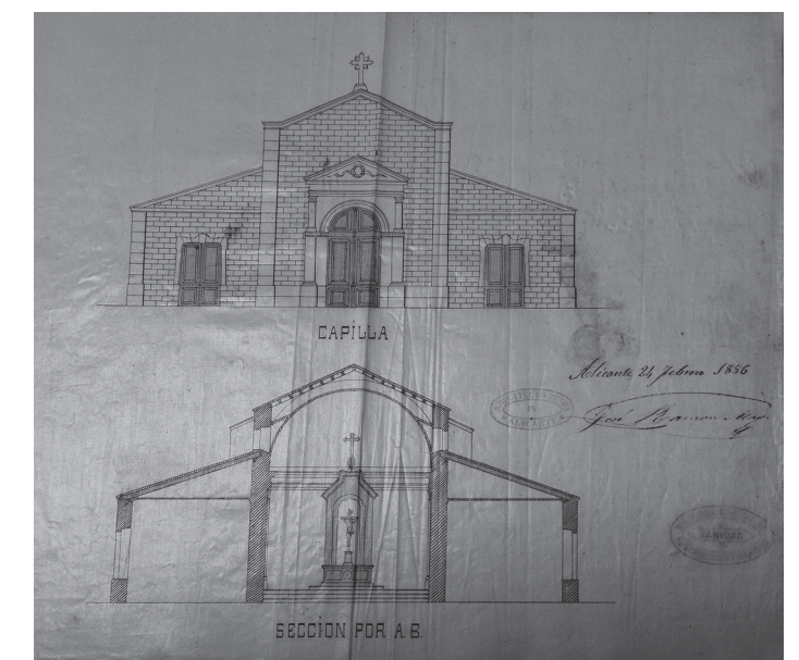
Planos de la fachada del Cementerio Municipal actual (1887)