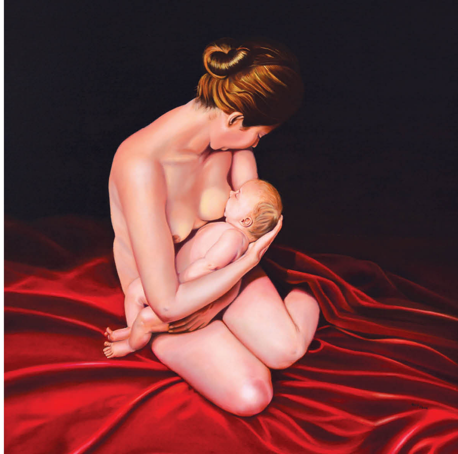
Maternidad Óleo sobre lienzo 100 x 100 cm