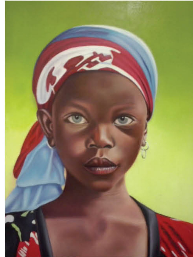
Niña de ojos azules Óleo sobre lienzo 38 x 46 cm