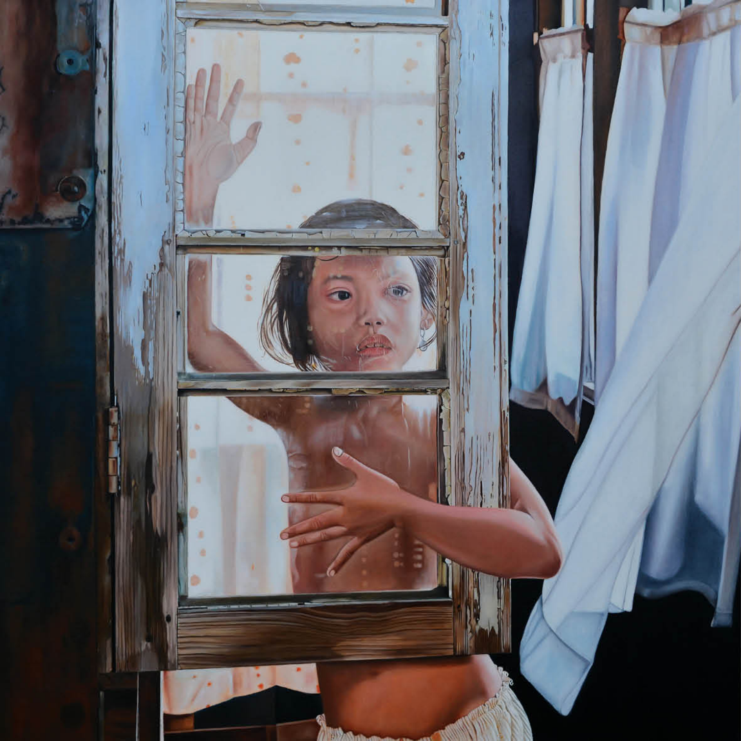
Niña en la ventana Óleo sobre lienzo 100 x 100 cm