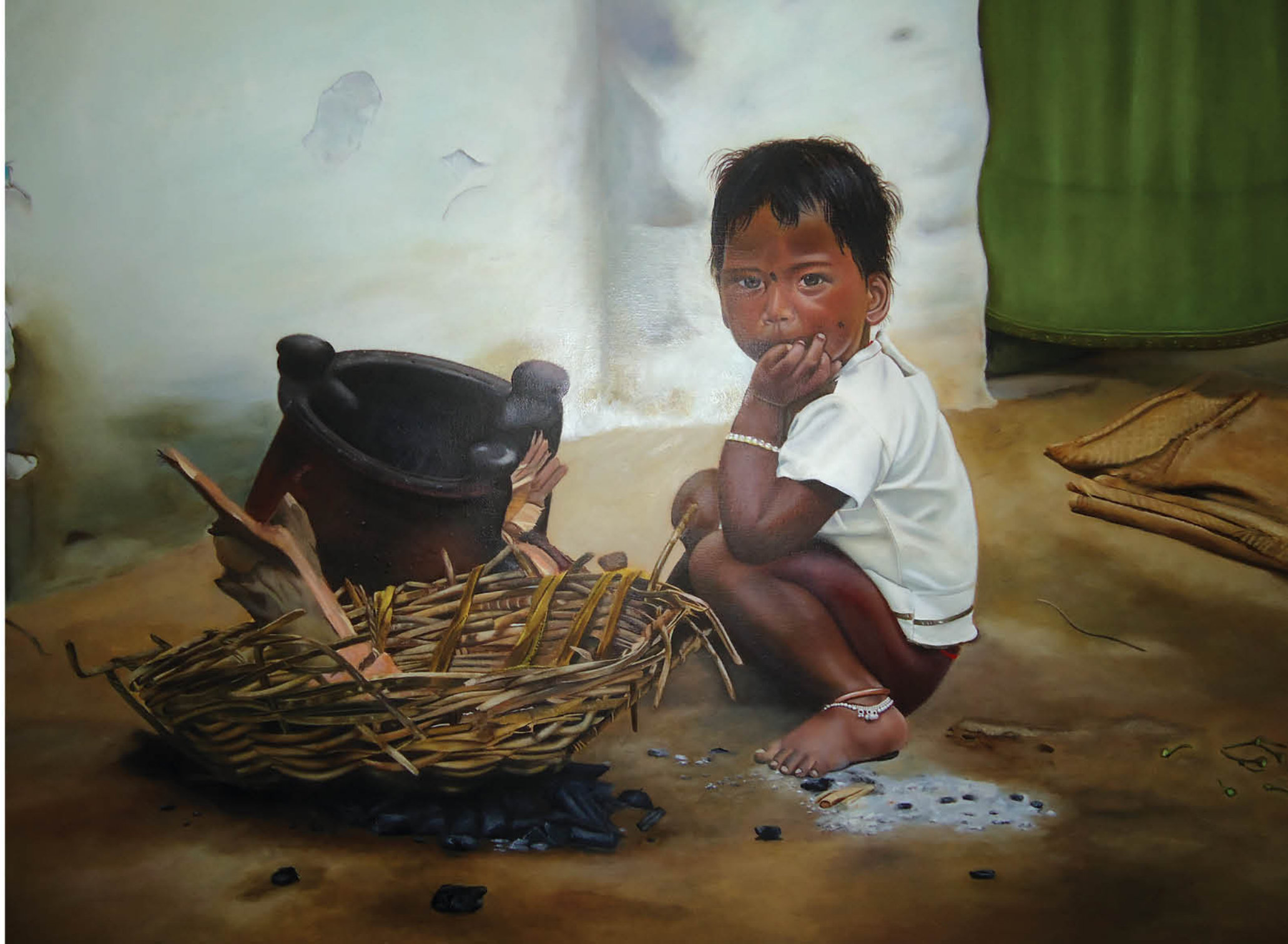
Niña Hindú Óleo sobre lienzo 65 x 81 cm