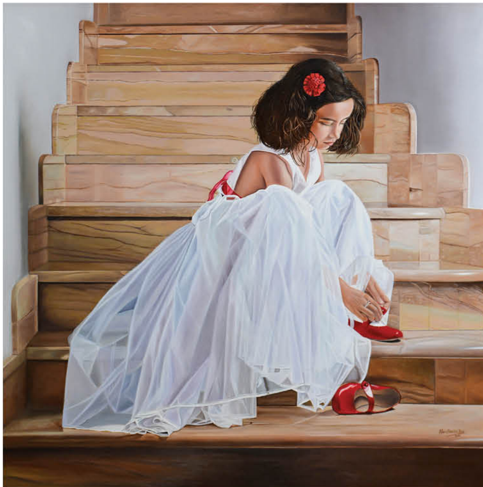
Carmen Óleo sobre lienzo 100 x 100 cm