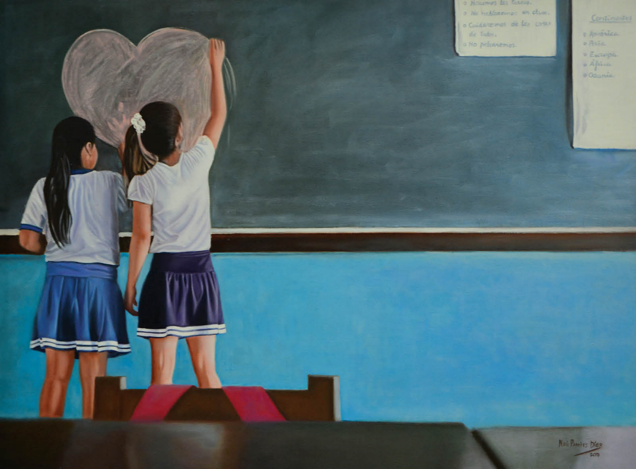
Niñas en el colegio jesuita de la selva de Pucallpa