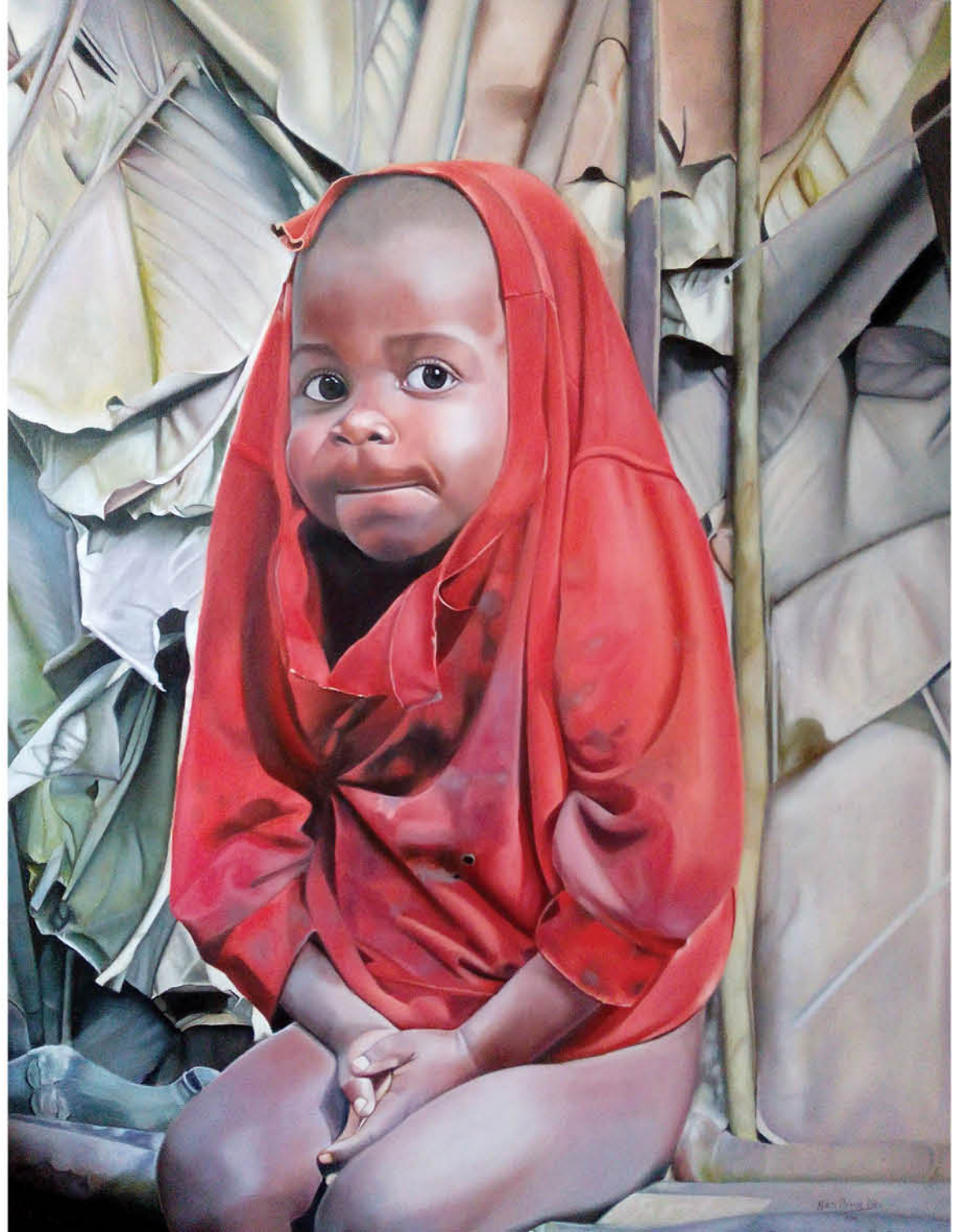
Niño con camiseta roja Óleo sobre lienzo 73 x 92 cm