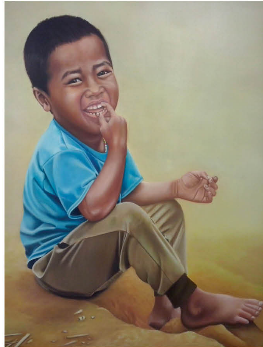
Niño Camboyano Óleo sobre lienzo 81 x 65 cm