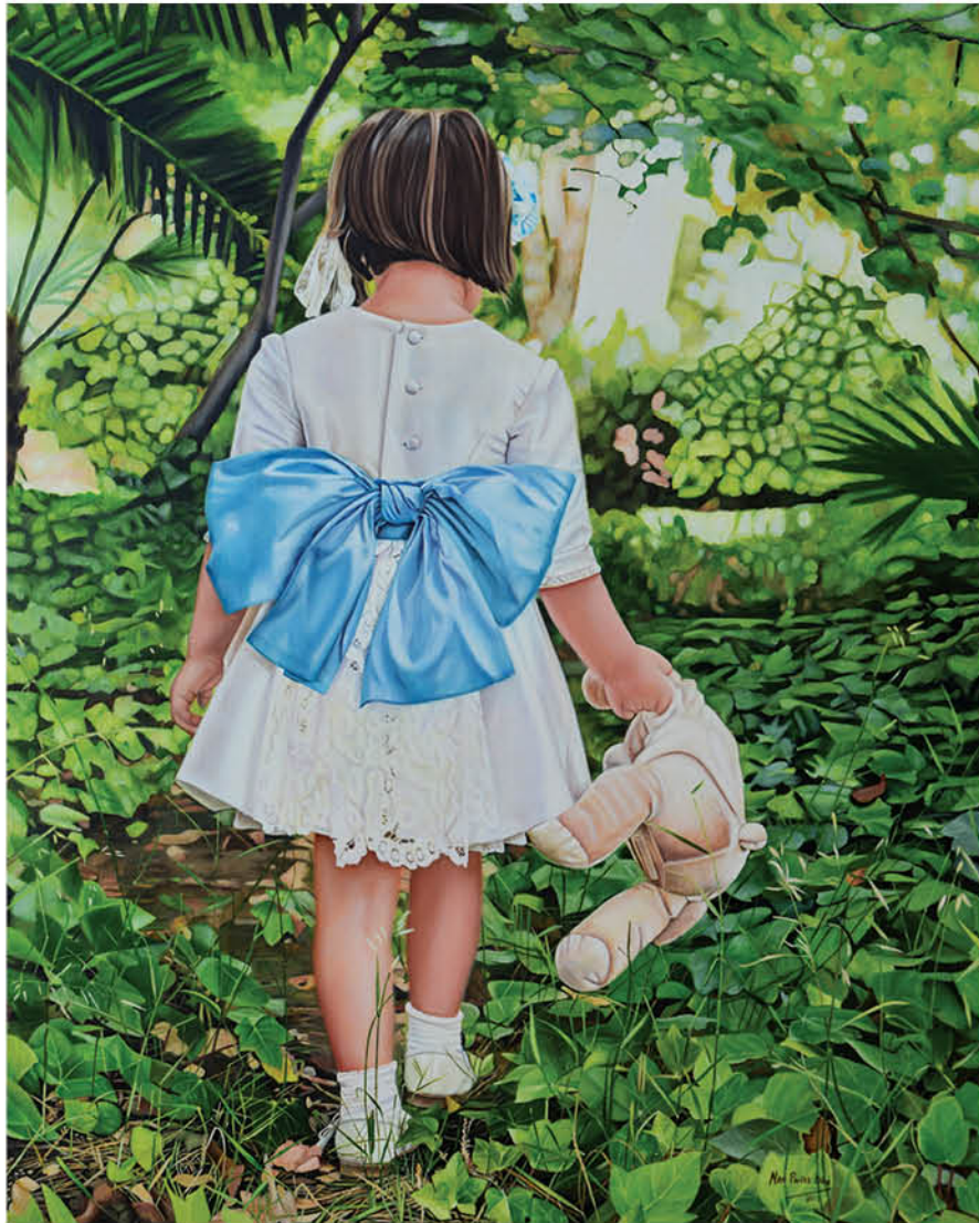
María Óleo sobre lienzo 65 x 81 cm