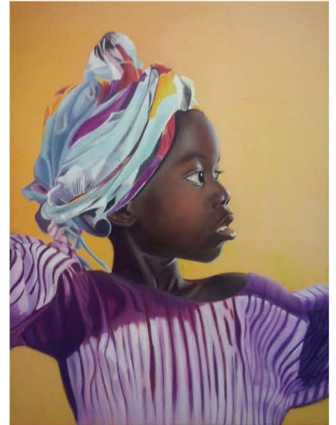
Niña africana Óleo sobre lienzo 38 x 46 cm