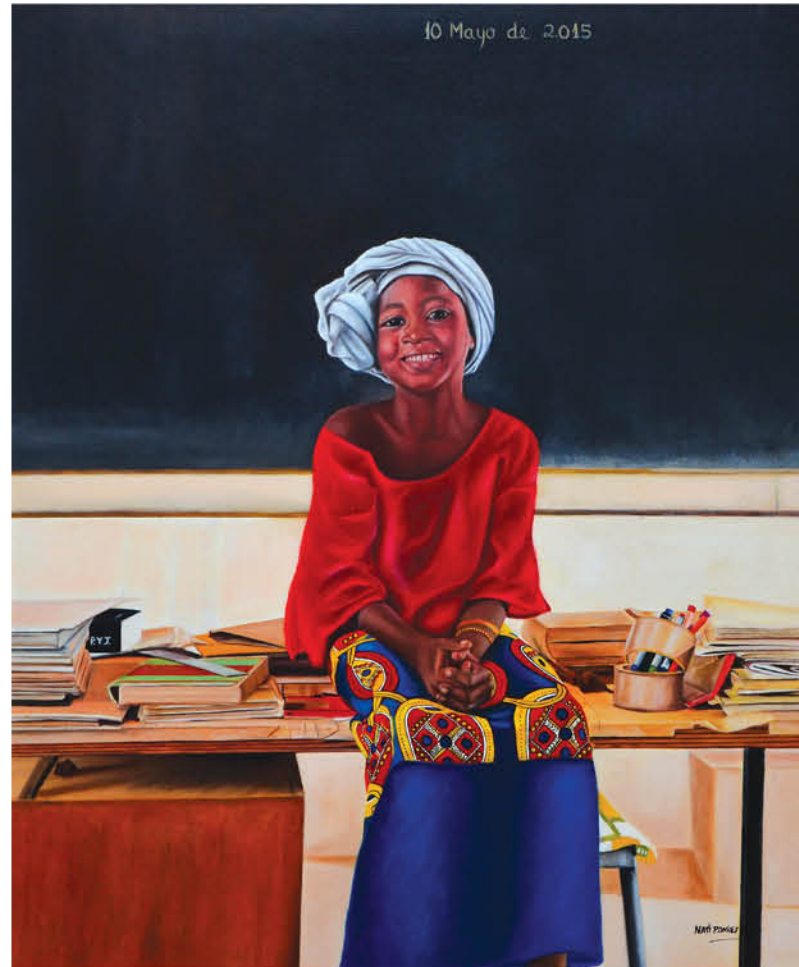
Maestra africana Óleo sobre lienzo 65 x 54 cm