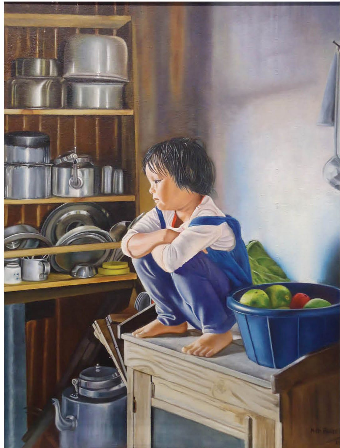
Niña en la cocina Óleo sobre lienzo 55 x 46 cm