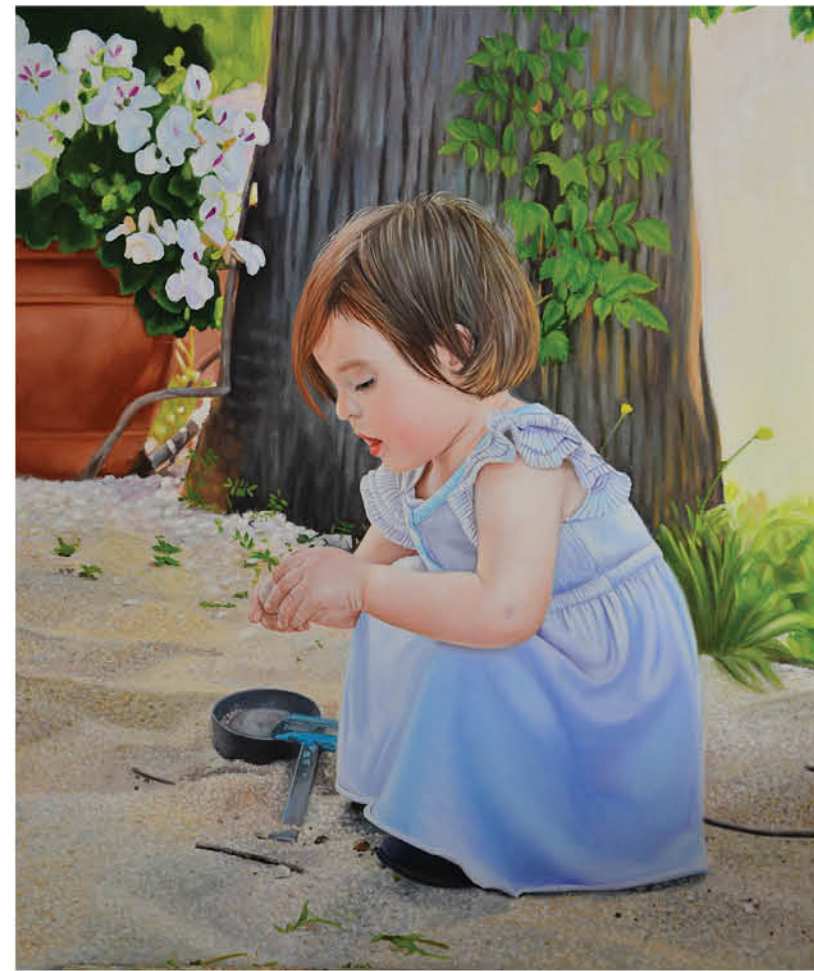
Isabel Óleo sobre lienzo 65 x 54 cm