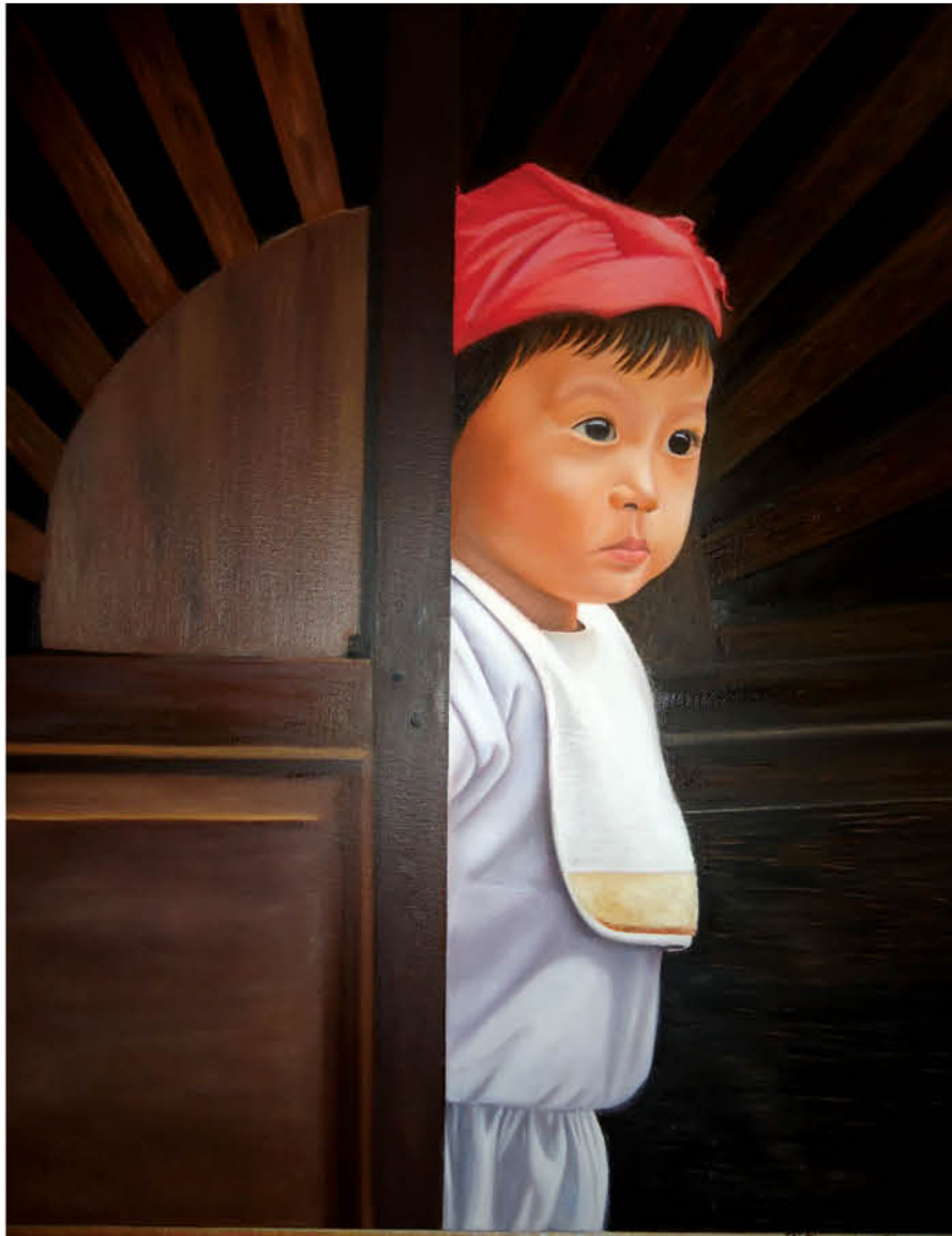
Niño en la puerta Óleo sobre lienzo 65 x 54 cm