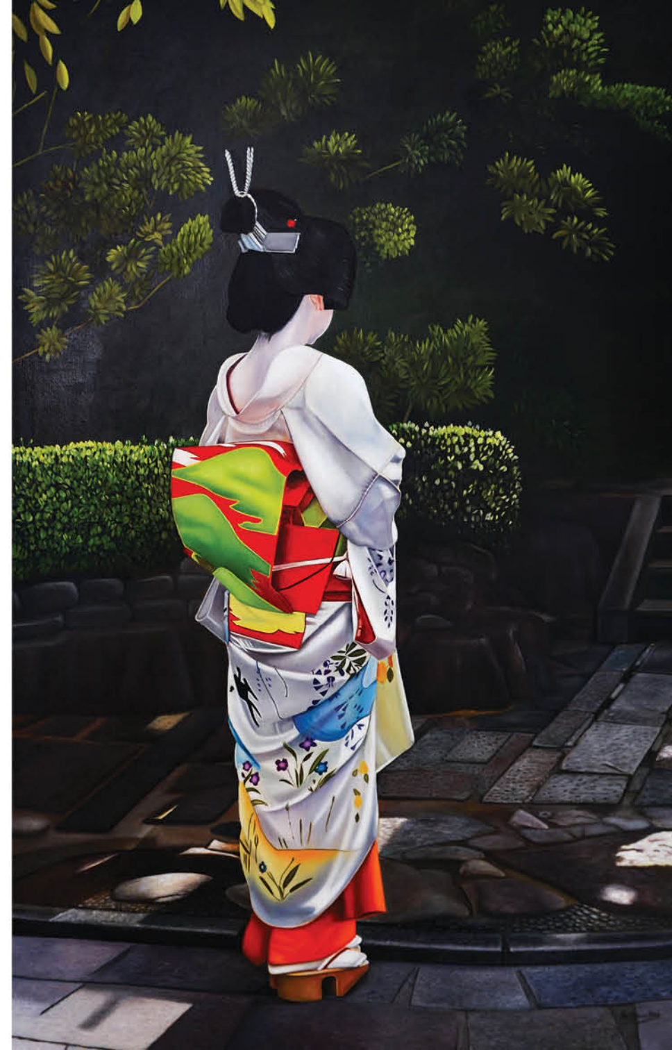
Maiko Óleo sobre lienzo 160 x 100 cm