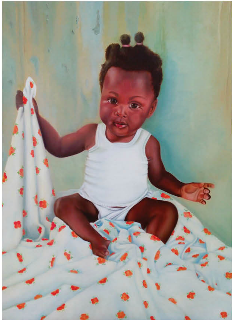
Niña con mantita Óleo sobre lienzo 81 x 65 cm