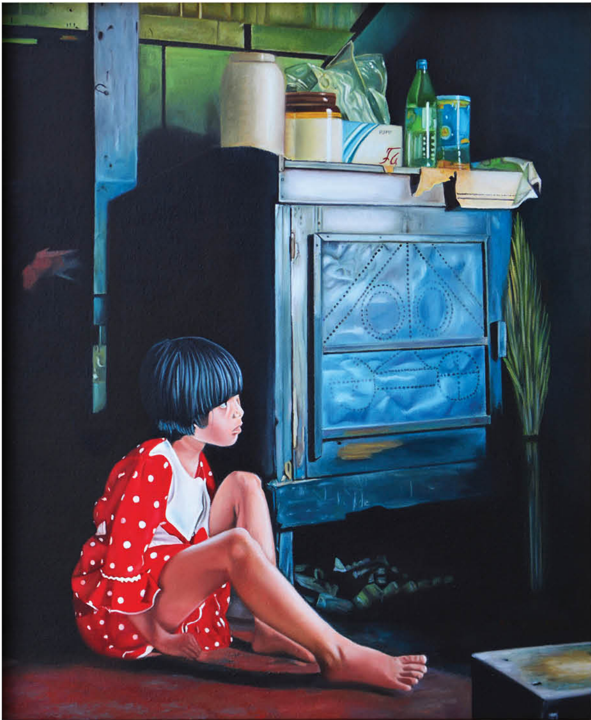
Niña con vestido rojo Óleo sobre lienzo 55 x 46 cm