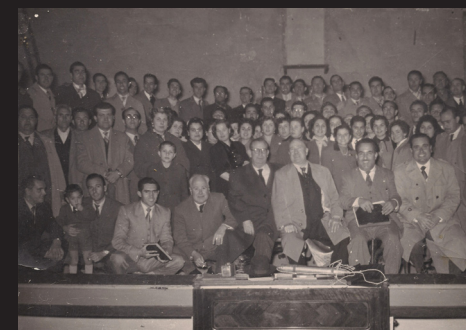
Teatro Chapí. 1955.