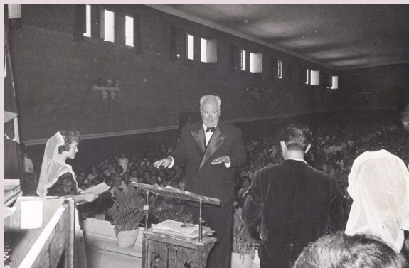
Actuación Cinema Iris. 1955.

Durante algunos años el maestro coordina la labor de dirección de dicha coral, con la creación de orquestas locales como, ORQUESTA IBÉRICA y ORQUESTA CHAPÍ. Muy pronto en Coral Crevillentina empiezan a destacar voces que con una excelente preparación acometen la interpretación de obras tales como: LA ROMANZA DE LA TABERNERA DEL PUERTO, SERENATA DE SCHUBERT, EL ANILLO DE HIERRO, LA DEL SOTO DEL PARRAL, DON GIL DE ALCALÁ, EL HIMNO A CREVILLENTE, EL AMOR CIEGO DE PENELLA, y un sinfín de obras que suelen interpretar durante las veladas artísticas que en aquella época eran tan habituales.