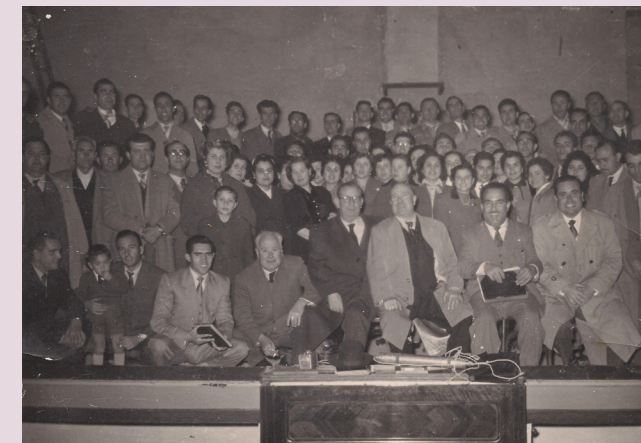
Teatro Chapí. 1955