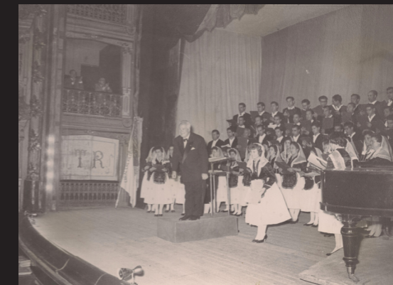
Teatro Romea - Murcia. 1957.