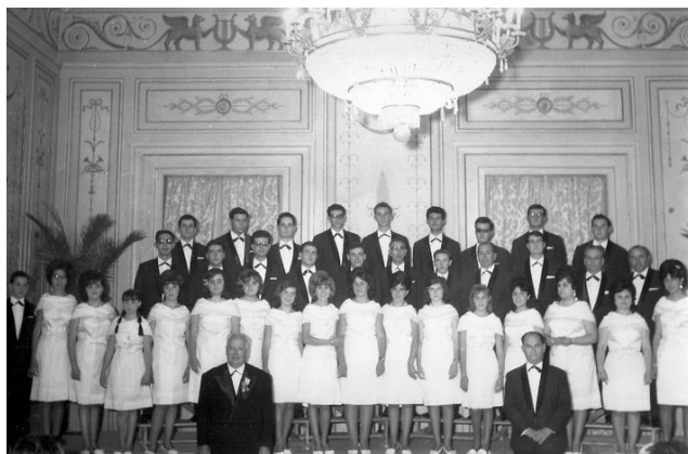
Concierto Casino de Orihuela. 1965.