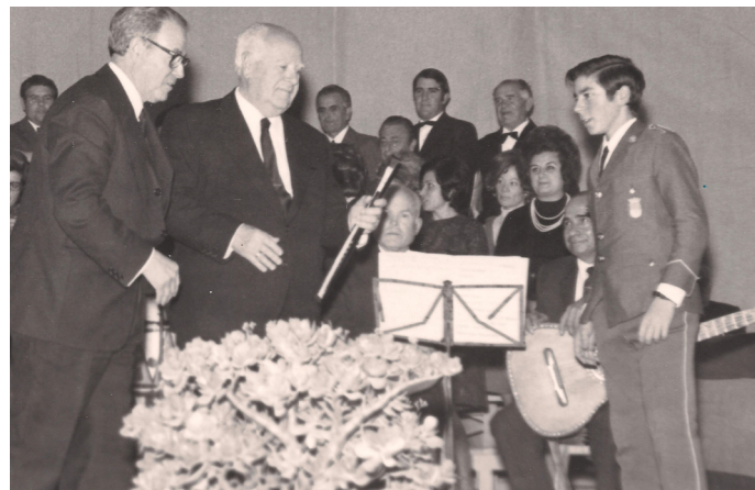
Momento homenaje. 1972.