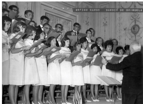
Actuación Casino Orihuela. 1965.