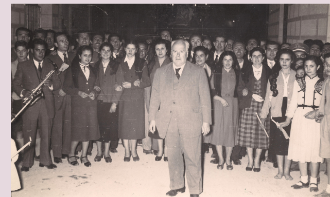
Coro Virgen de las Angustias. 1944.