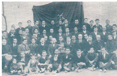
Orquesta Crevillent. 1925.