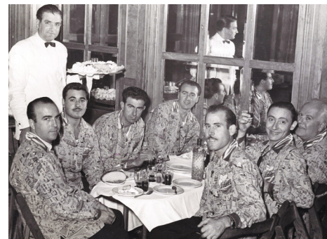
Orquesta del Parque Municipal de Elche. 1957.