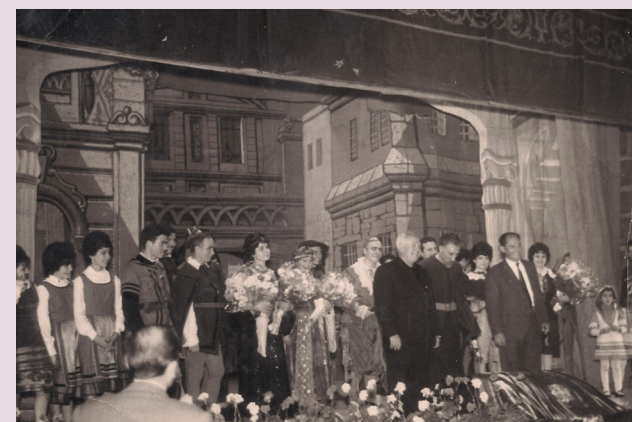
Zarzuela en Teatro Romea - Murcia. 1963