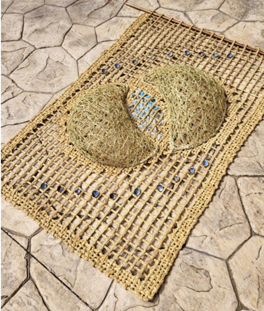
LLUNA D'AIXABEGÓ Medidas: 75x14x120 cm Técnicas: Tejido de malla, técnica nido y modelado en papel Materiales: Esparto, tela teñida y papel

TEJIDO DE MALLA: Técnica que consiste en unir cuerdas horizontales con verticales formando redes con malla más o menos ancha. La unión puede ser mediante cosido o anudado. Existe una pieza tradicional de esparto llamada “Aixabegó” que se empleó ampliamente como una gran bolsa o recipiente para cargar paja, hierba, leña, botijos etc.