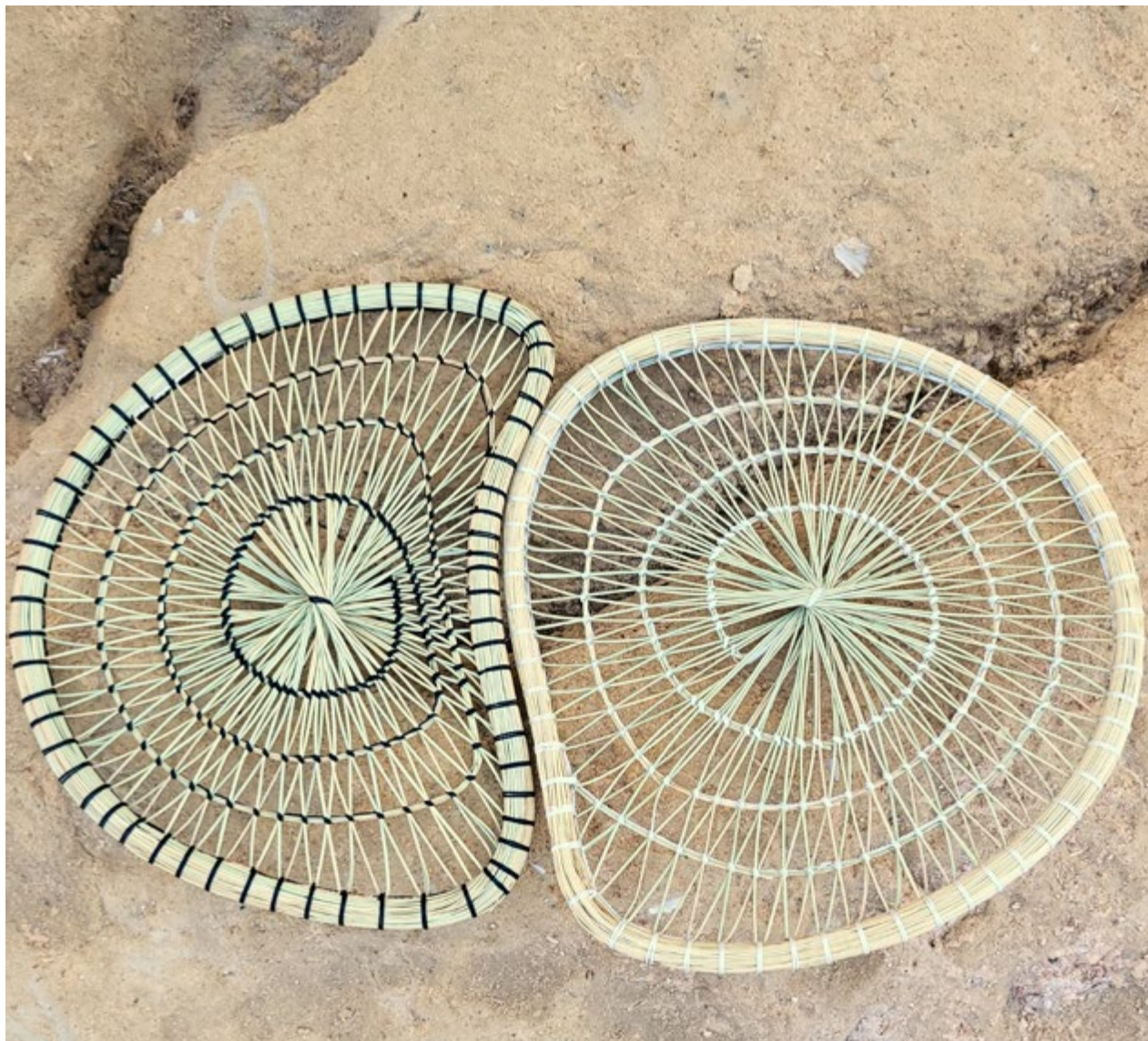
TAFARRA (2 piezas)