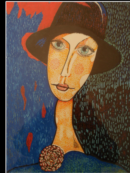
Obra de la serie “Caras y Cuerpos”

Viví un tiempo la vida Vanguardista del Montmartre de Monet, Picasso, Van Gogh y el Montparnasse de Zola, Manet, Degas, etc. Allí me hubiera quedado para siempre entre pintores para seguir en lo que me había enseñado mi viejo profesor de Arte en la carrera. Pero el destino de cada uno cree que está determinado y marcado o escrito en los genes y nadie lo puede alterar. En una de las salidas o visitas a lugares imprescindibles a París conocí al mayor genio de la Psicología del siglo XX, el suizo Jean Piaget. Cuando se enteró que mi ilusión era el Arte, y en concreto, la Pintura; me dio el siguiente consejo. “Su misión no es ser pintor y sí escultor, pero escultor de mentes desafinadas”. Le obedeció y así fue como desde ese momento dedicó su larga vida profesional a los niños con problemas Psíquicos, Físicos y del Comportamiento más a la Audición y Lenguaje.