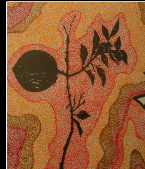
Obra de la serie: “Ni caras ni cuerpos”