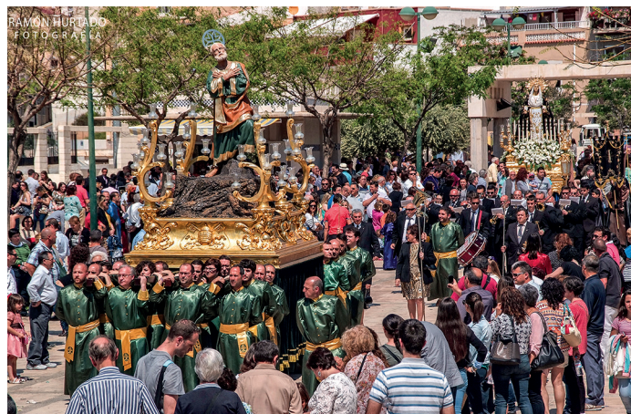
Procesión de Bajada del Calvario. Autor: Ramón Hurtado (2014).

nes Santo por la mañana, tras el Abrazo de la Morquera, comienza la subida al Calvario de las 16 imágenes de la Pasión de Cristo y allí, tiene lugar el segundo Encuentro entre el Nazareno y la Virgen Dolorosa, su momento de mayor esplendor, quedando en exposición los pasos hasta la procesión de Bajada.