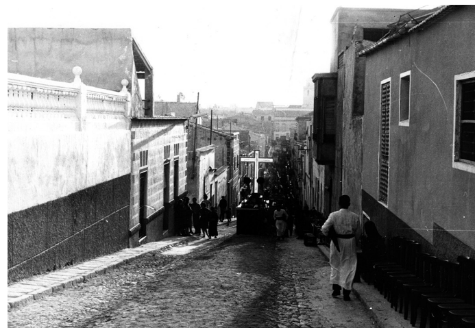
Procesión Subida al Calvario (años 40)

Rosario y de la ermita de la Nuestra Señora de la Concepción, que luego fueron devueltos.