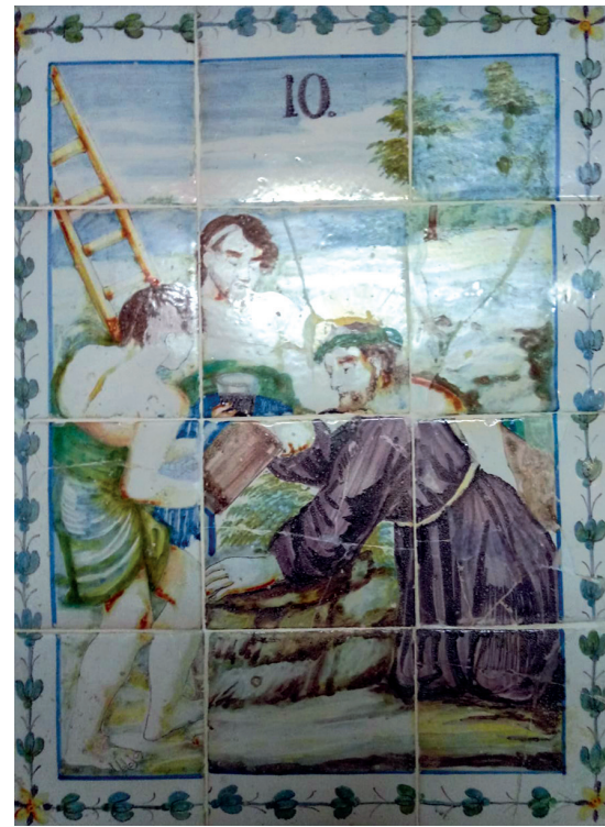
Cerámica correspondiente a la 10ª Estación del Vía Crucis. Siglo XIX. Museo de la Semana Santa.

Coma anécdota el 13 de abril de 2014, con motivo de 50 aniversario de la parroquia de la Santísima Trinidad, la procesión del Domingo de Ramos atravesó este paseo hacia la calle San Sebastián.