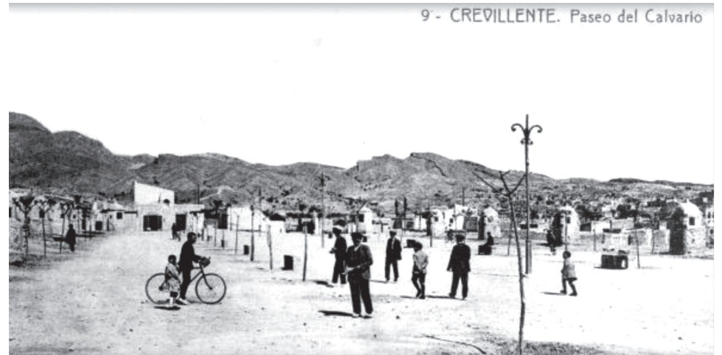
Paseo del Calvario con las capillas antiguas del Vía Crucis (1926)