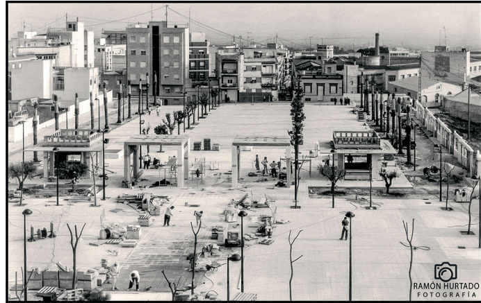
Obras de remodelación del Paseo del Calvario. Autor: Ramón Hurtado (1999)

nes Santo por la mañana, tras el Abrazo de la Morquera, comienza la subida al Calvario de las 16 imágenes de la Pasión de Cristo y allí, tiene lugar el segundo Encuentro entre el Nazareno y la Virgen Dolorosa, su momento de mayor esplendor, quedando en exposición los pasos hasta la procesión de Bajada.