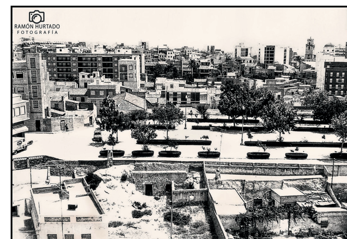
Vista del Paseo del Calvario y Boquera del Calvario. Autor: Ramón Hurtado (años 80).

Jueves Santo se celebra de la mano de la cofradía del Santísimo Cristo del Perdón y de la Buena Muerte y Regina Pacis.