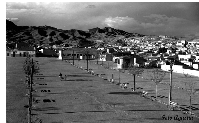
Vista del Calvario y la sierra. Autor: Agustín (años 60)

La función inicial de este espacio, la celebración del Via Crucis, ha sobrevivido hasta hoy y cada