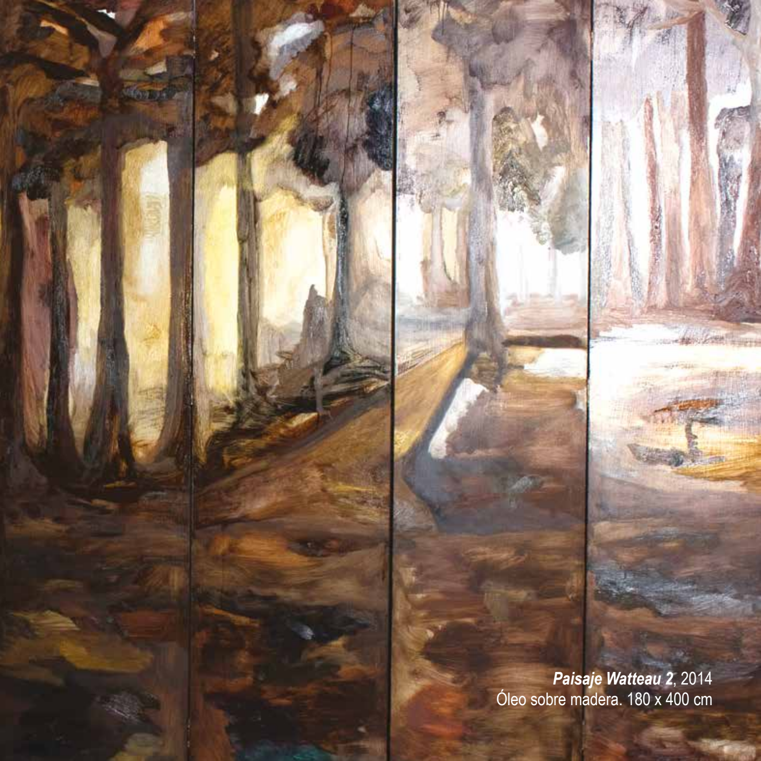
Paisaje Watteau 2 , 2014 Óleo sobre madera. 180 x 400 cm