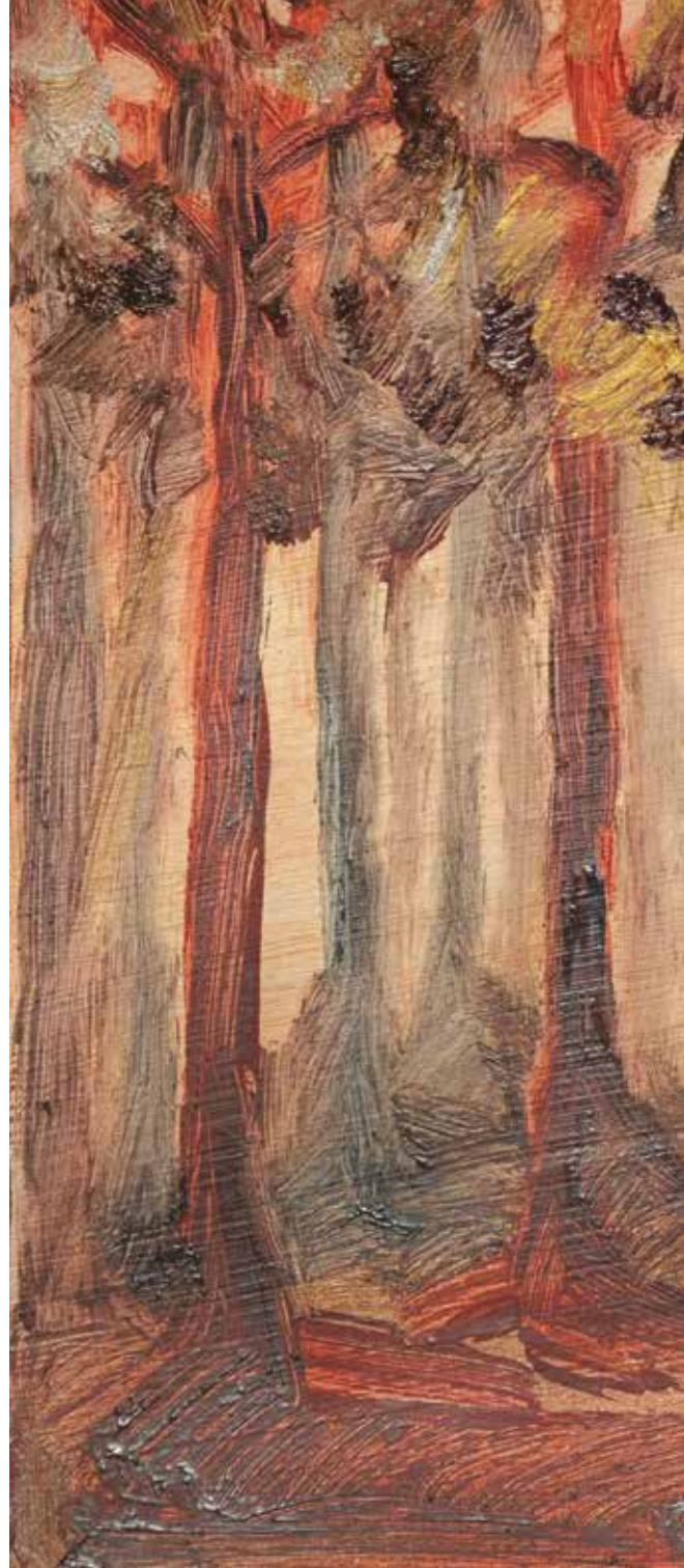
Paisaje cobrizo 1. 2010 Óleo sobre papel. 28,3 x 21 cm