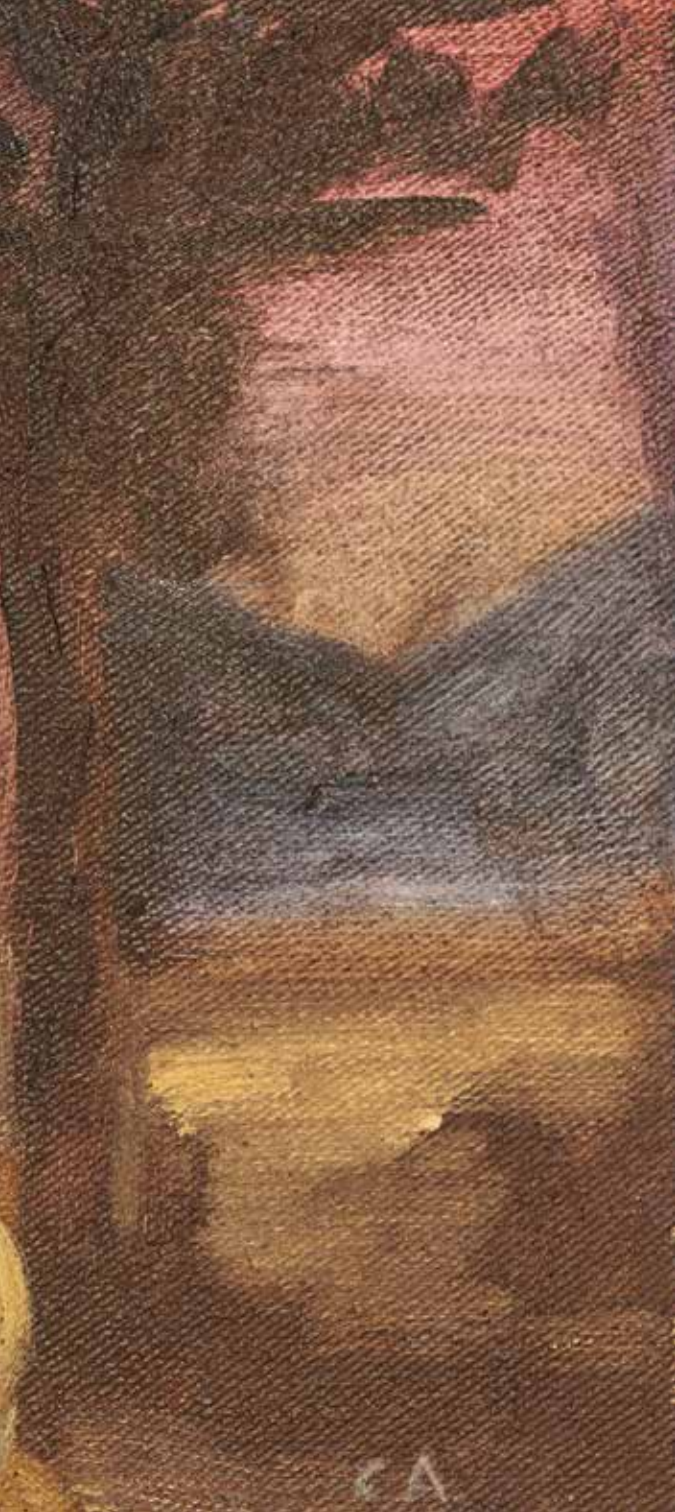
Camino al castillo , 2010 Óleo sobre tela. 33 x 24 cm