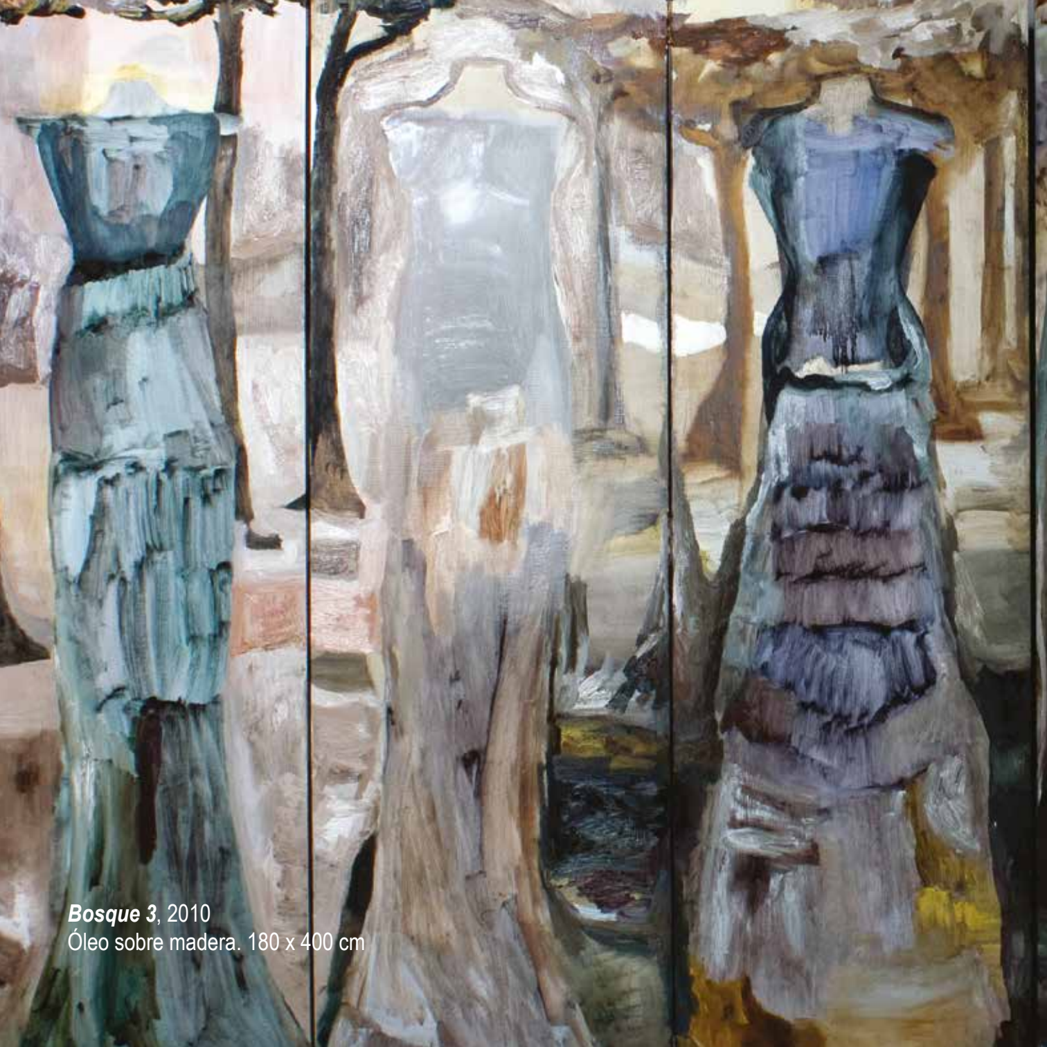
Bosque 3 , 2010 Óleo sobre madeira. 180 x 400 cm