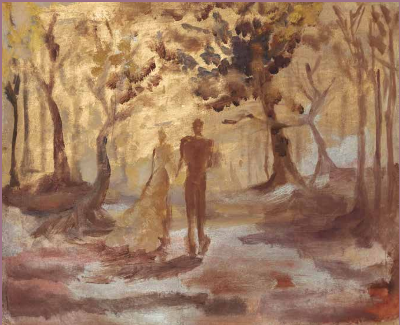
Pareja en paisaje dorado. 2010 Óleo y estuco sobre tela. 38,9 x 29,5 cm