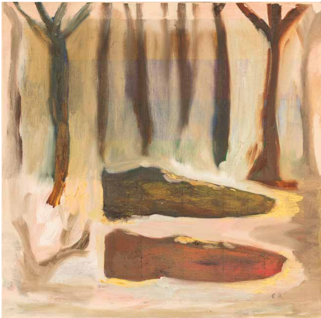
Dos zapatos. 2010 Óleo sobre madera. 40 x 40 cm