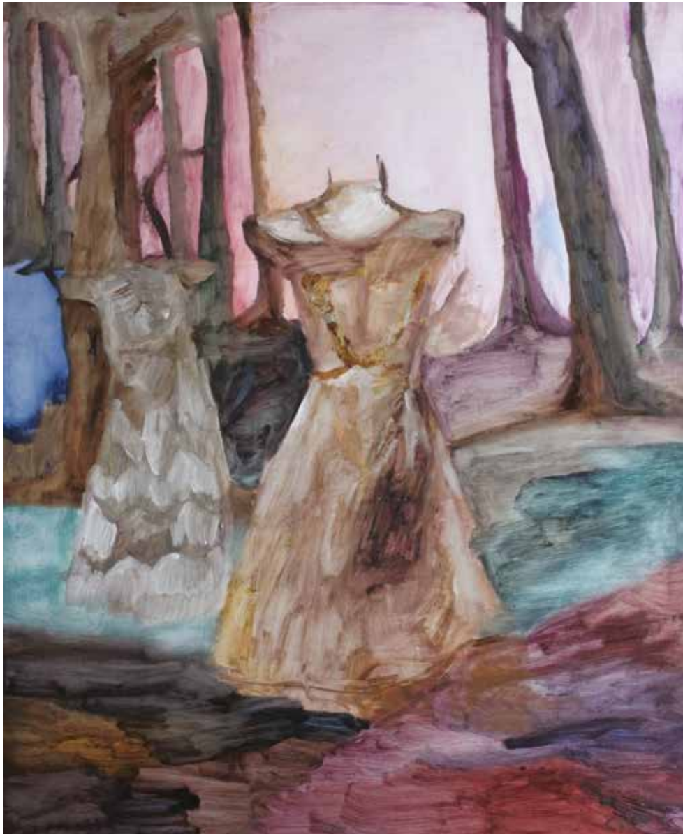
Maniquí en el bosque 2 , 2014 Óleo sobre madera. 100 x 81 cm