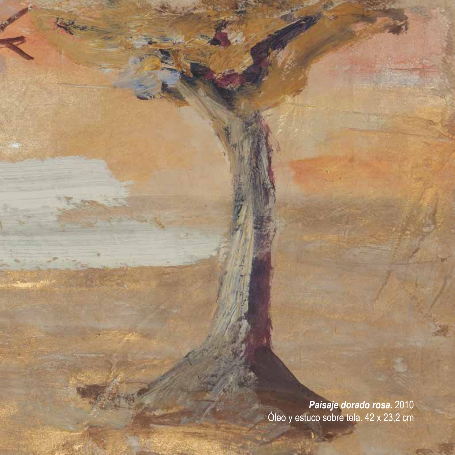
Paisaje dorado rosa. 2010 Óleo y estuco sobre tela. 42 x 23,2 cm