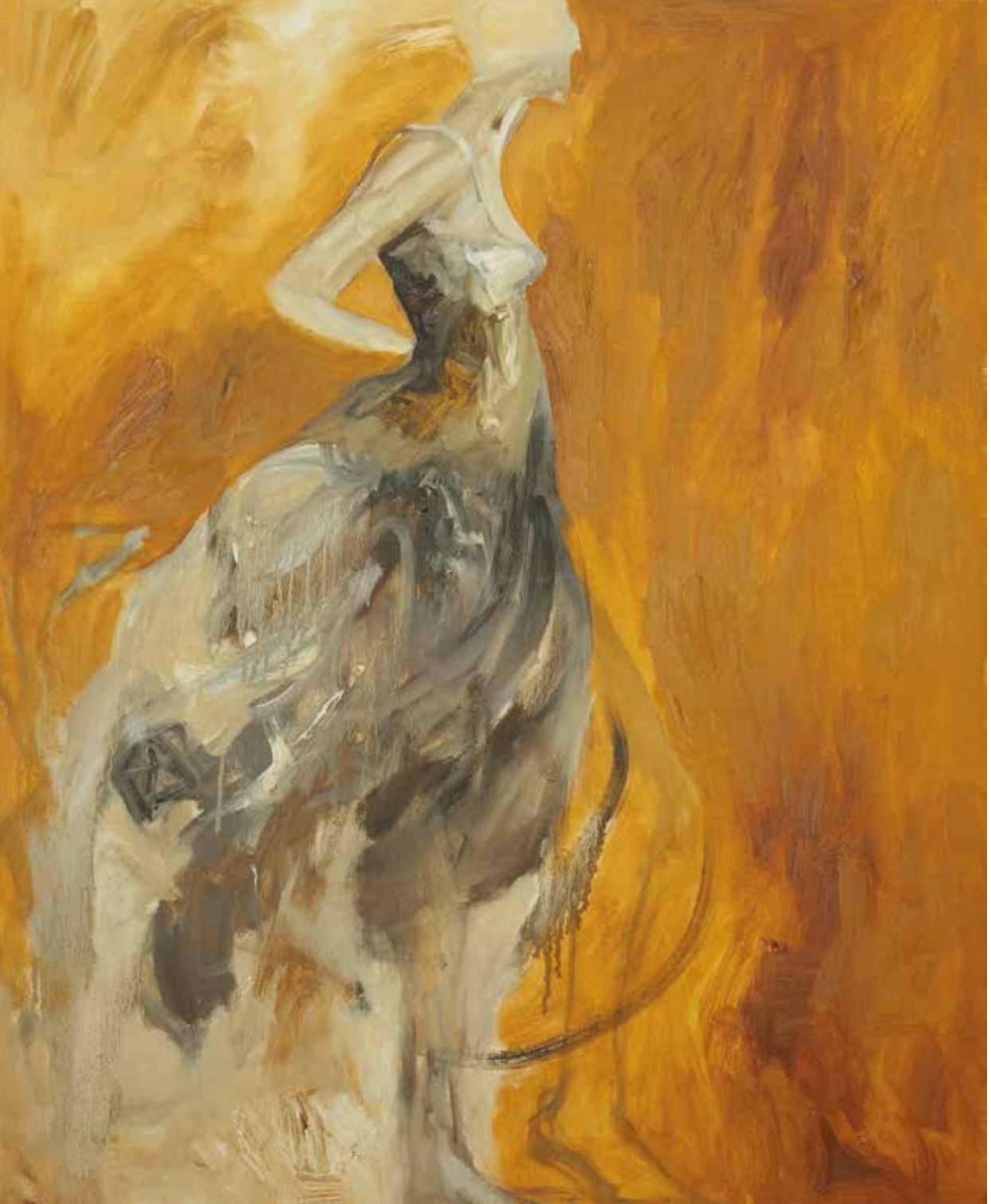
Modelo con fondo amarillo, 2005 Óleo sobre lienzo. 116 x 89 cm