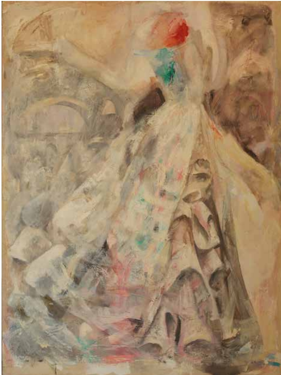
Gran vestido 2005 Técnica mixta sobre tela. 130 x 97 cm