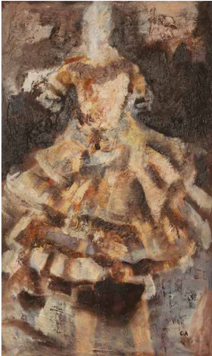
Gran vestido , 2010 Óleo sobre tela. 100 x 60 cm