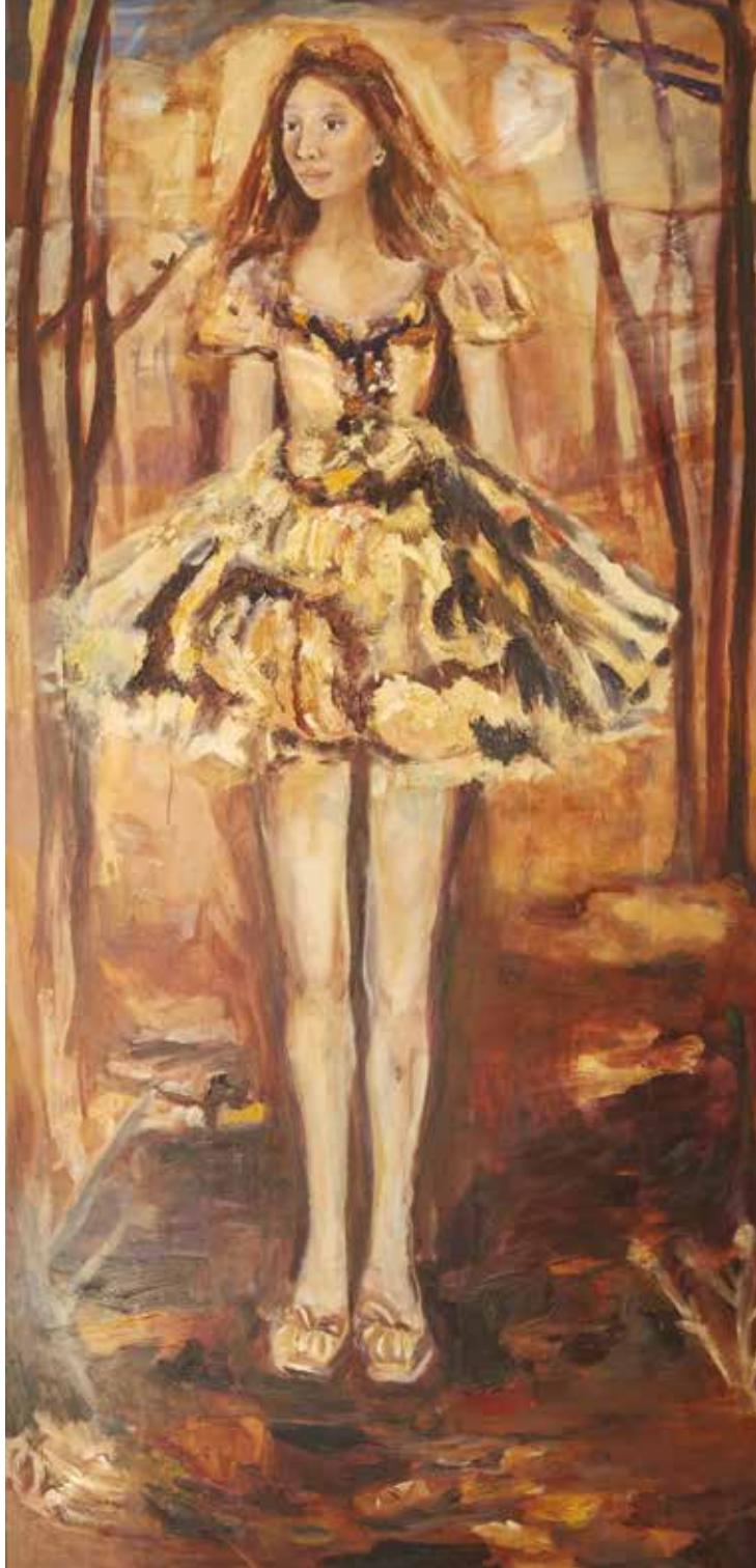
Autorretrato 1 , 2010 Óleo sobre madeira. 201 x 92,6 cm