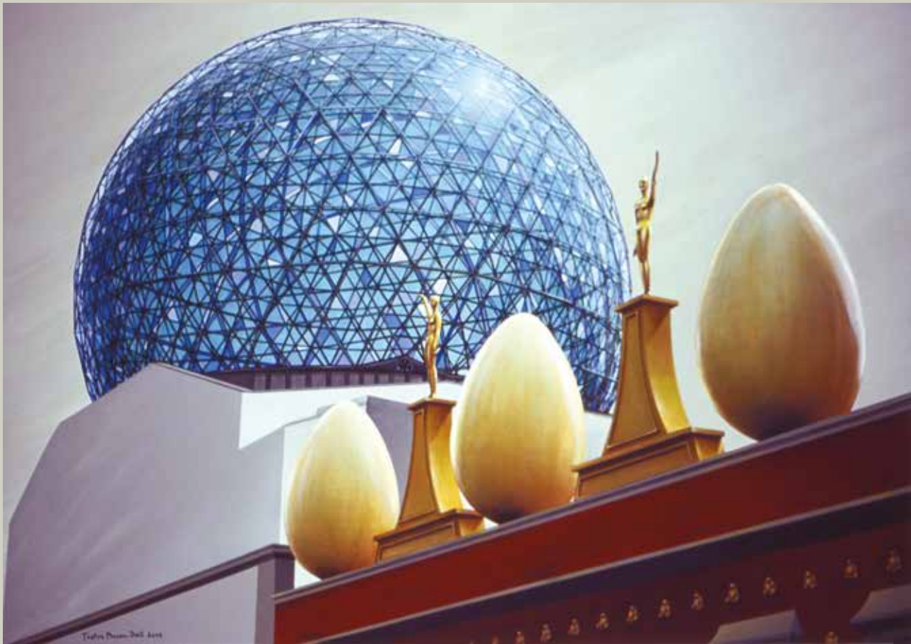
TEATRE MUSEU DALI 2008/ Figueres (Acrílic s/ llenç, 81x116)