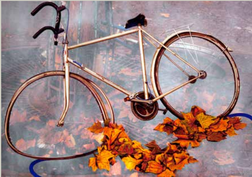
BICI-MURAL 2009/ Barcelona (Acrílic s/ llenç, 65x92)