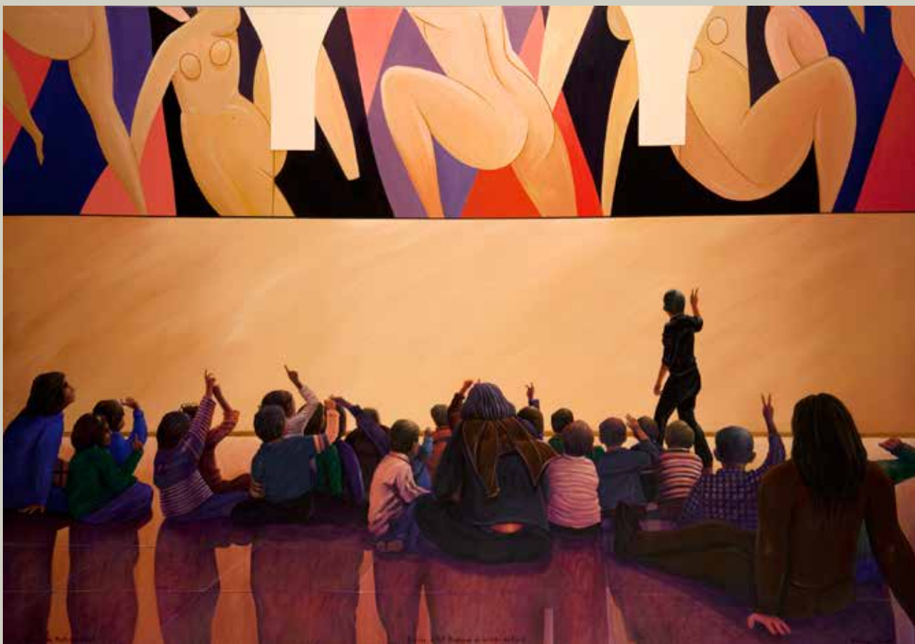
LA DANSE DE MATISSE 2008/ Paris (Acrílic s/ llenç, 114x162)