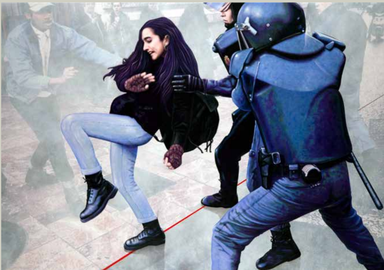
PRIMAVERA VALENCIANA 2012/ València (Acrílic s/ llenç, 114x162)