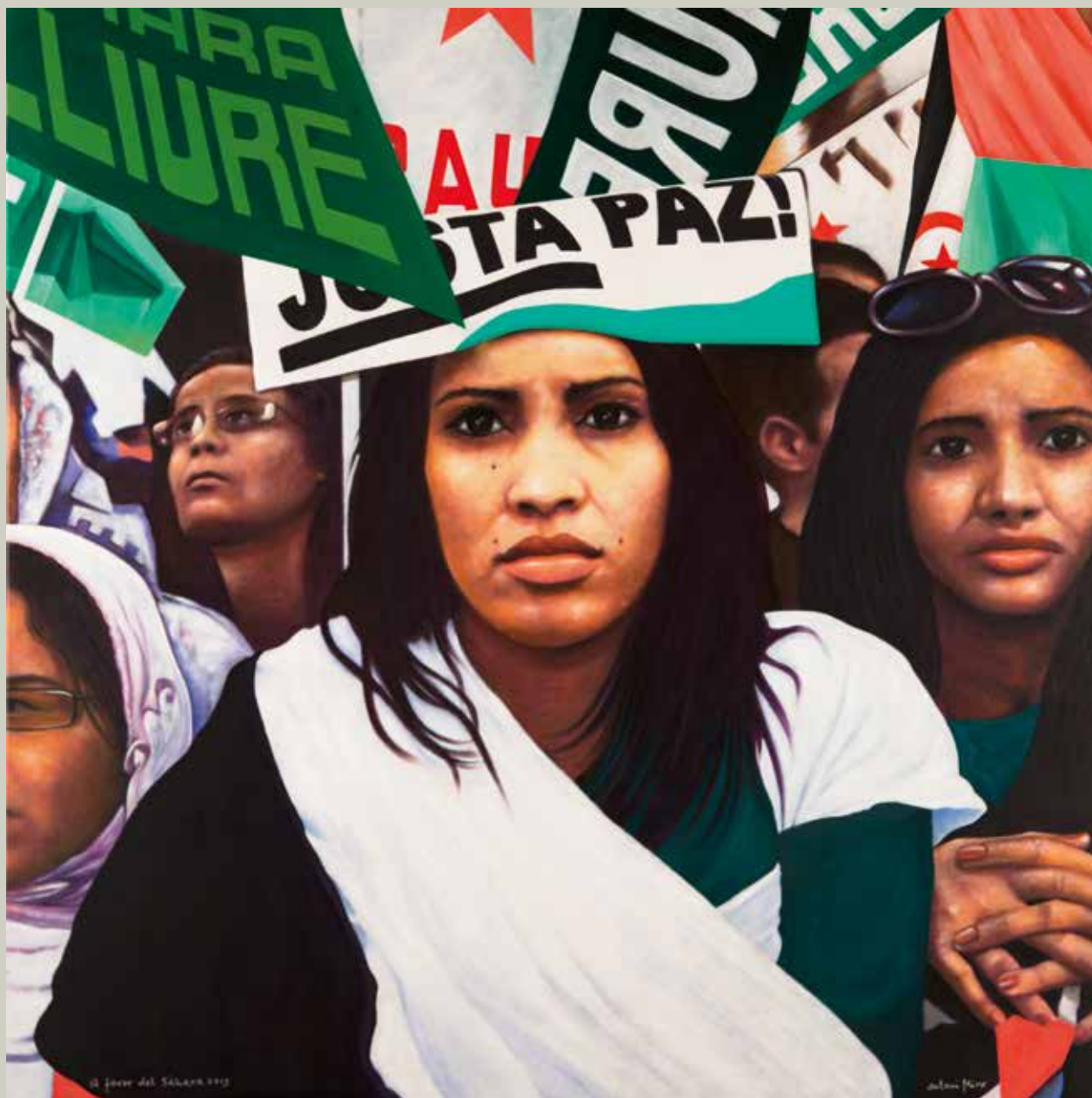
A FAVOR DEL SAHARA 2013/ Madrid (Acrílic s/ llenç, 116x116)