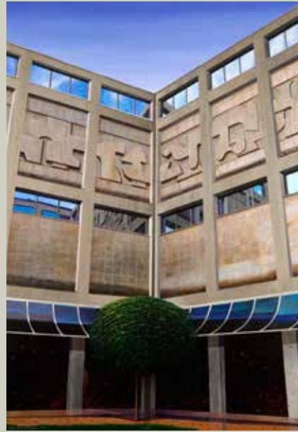
MANET A ORSAY 2008/ Paris (Acrílic s/ llenç, 92x65)