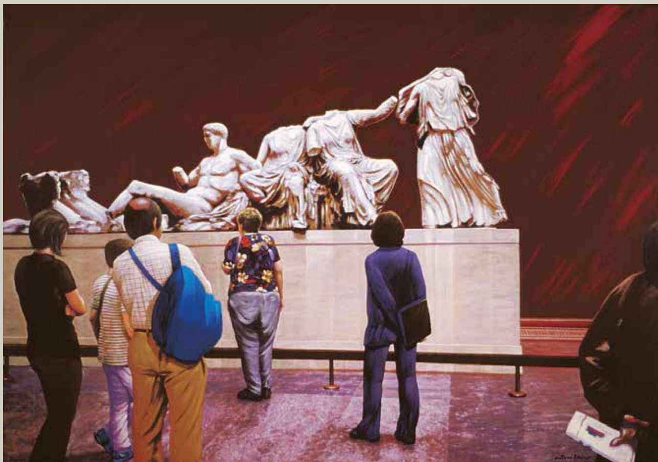
GRÈCIA AL BRITISH 2002/ Londres (Acrílic i metall s/ llenç, 81x116)