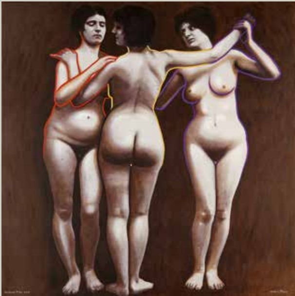
GRÀCIES TRES 2015/ Barcelona (Acrílic s/ llenç, 116x116)