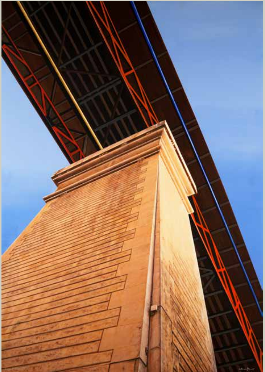
SUPORT VIADUCTE 2015/ Alcoi (Acrílic s/ llenç, 162x114)