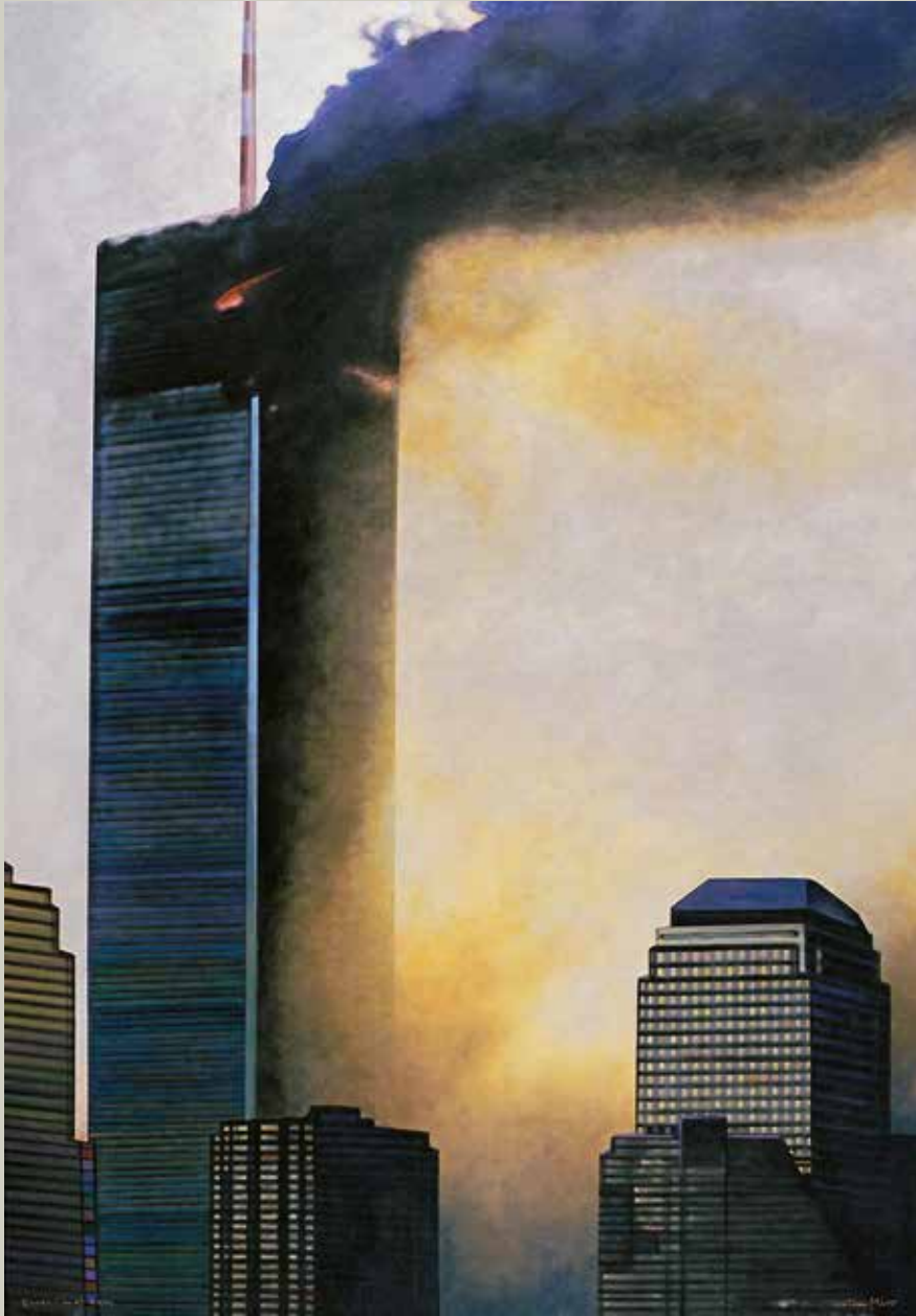
ESCAC I MAT 2004/ Nova York (Acrílic s/ llenç, 116x81)