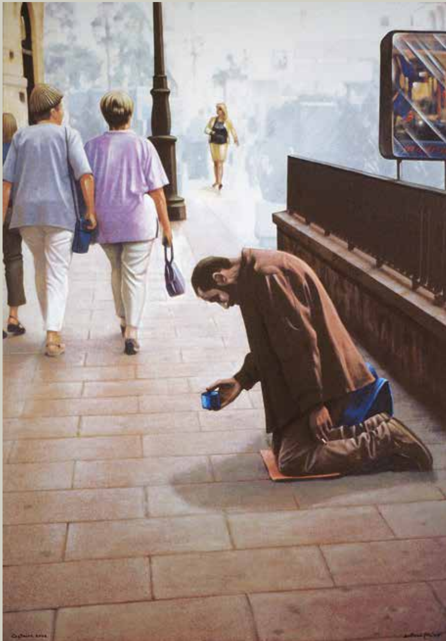
CAPTAIRE 2002/ Madrid (Acrílic s/ llenç, 116x81)