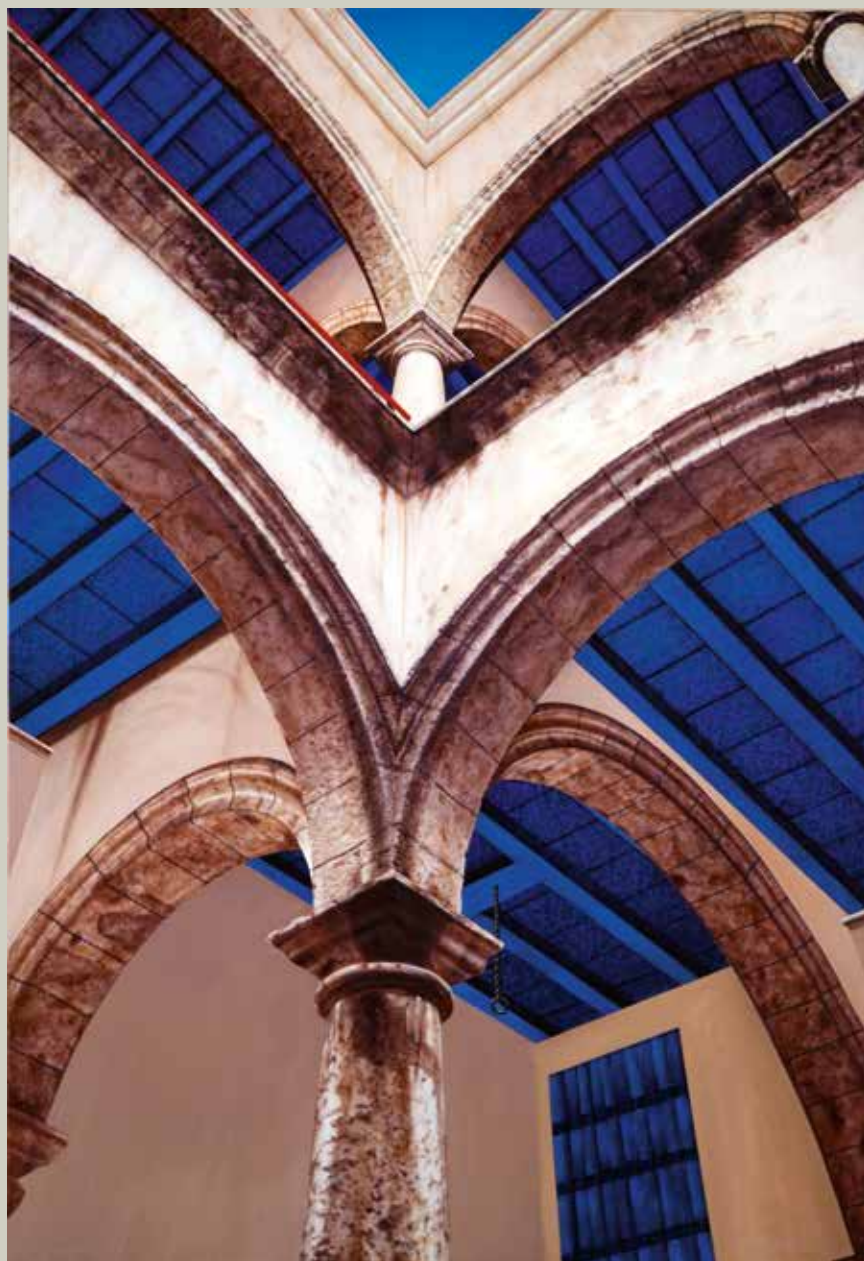
L'HAVANA VELLA 2012/ Cuba (Acrílic s/ llenç, 116x81)