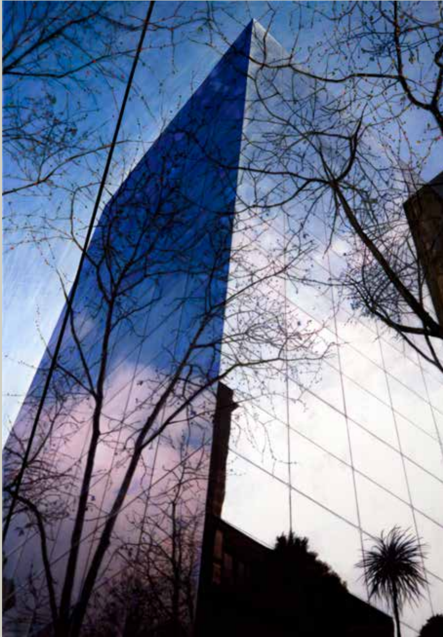
MIRALL BARCELONA 2011 (Acrílic s/ llenç, 92x65)