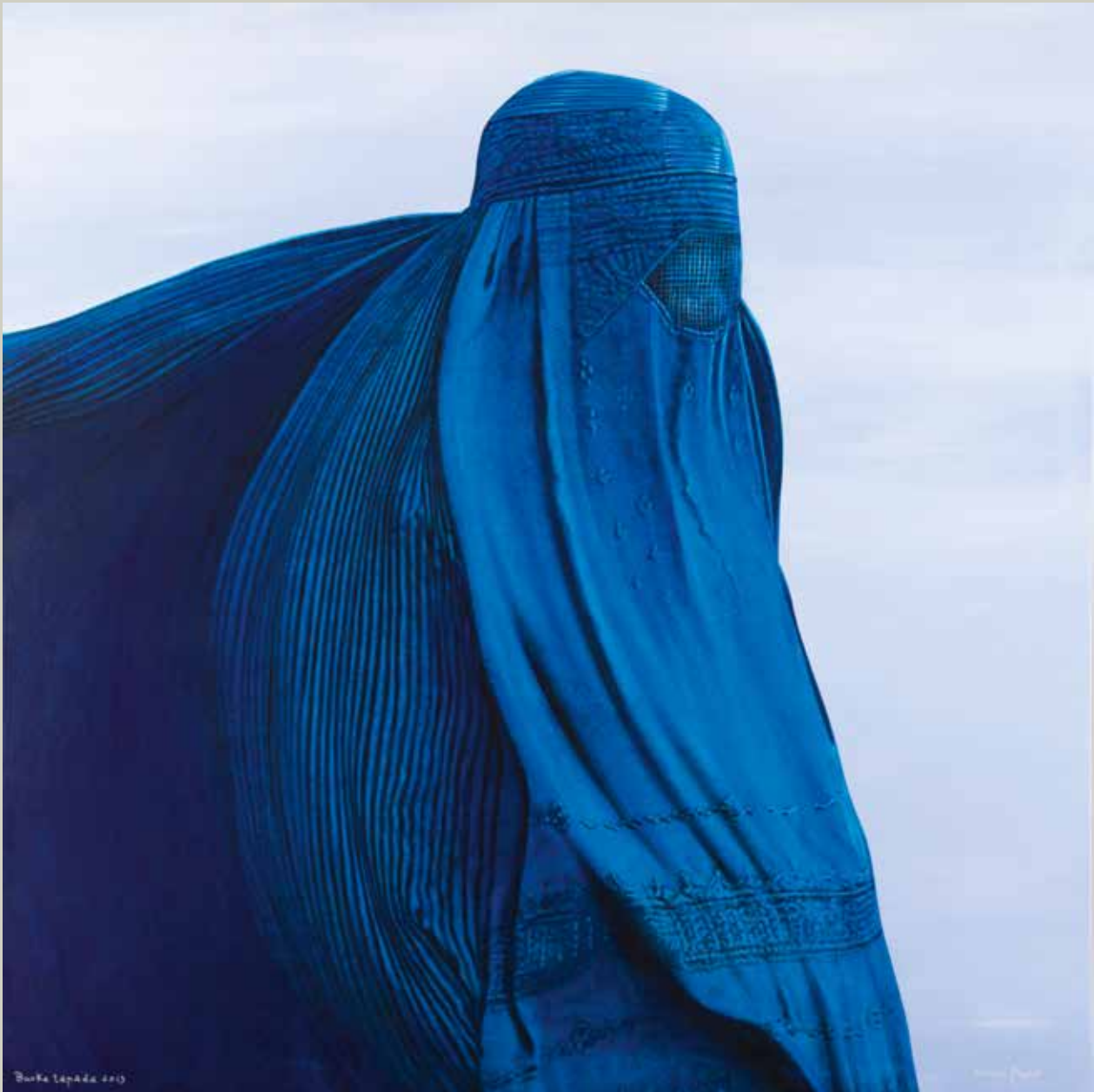
BURKATAPADA 2013/ Kabul (Acrílic s/ llenç, 116x116)