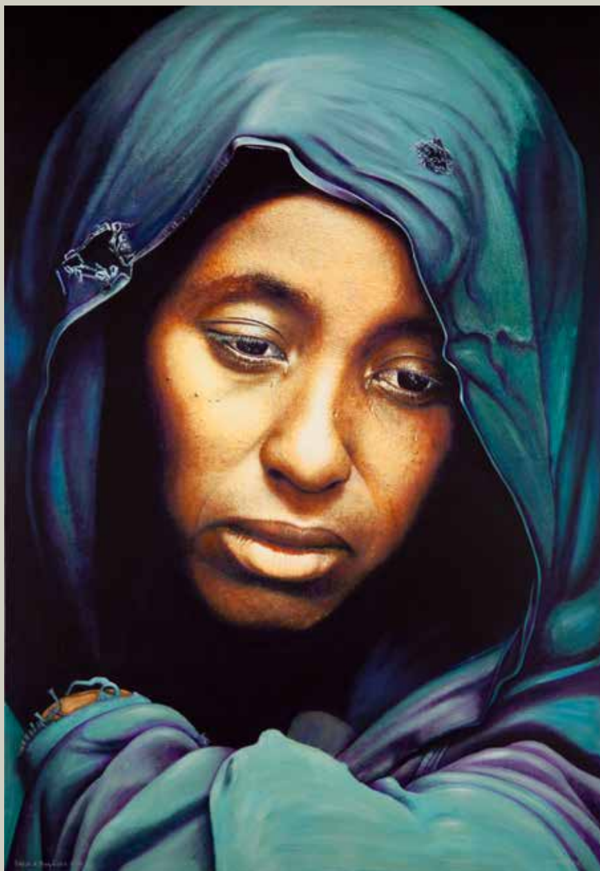
SAFIA A MUQDISHO 2012/ Somàlia (Acrílic s/ llenç, 162x114)