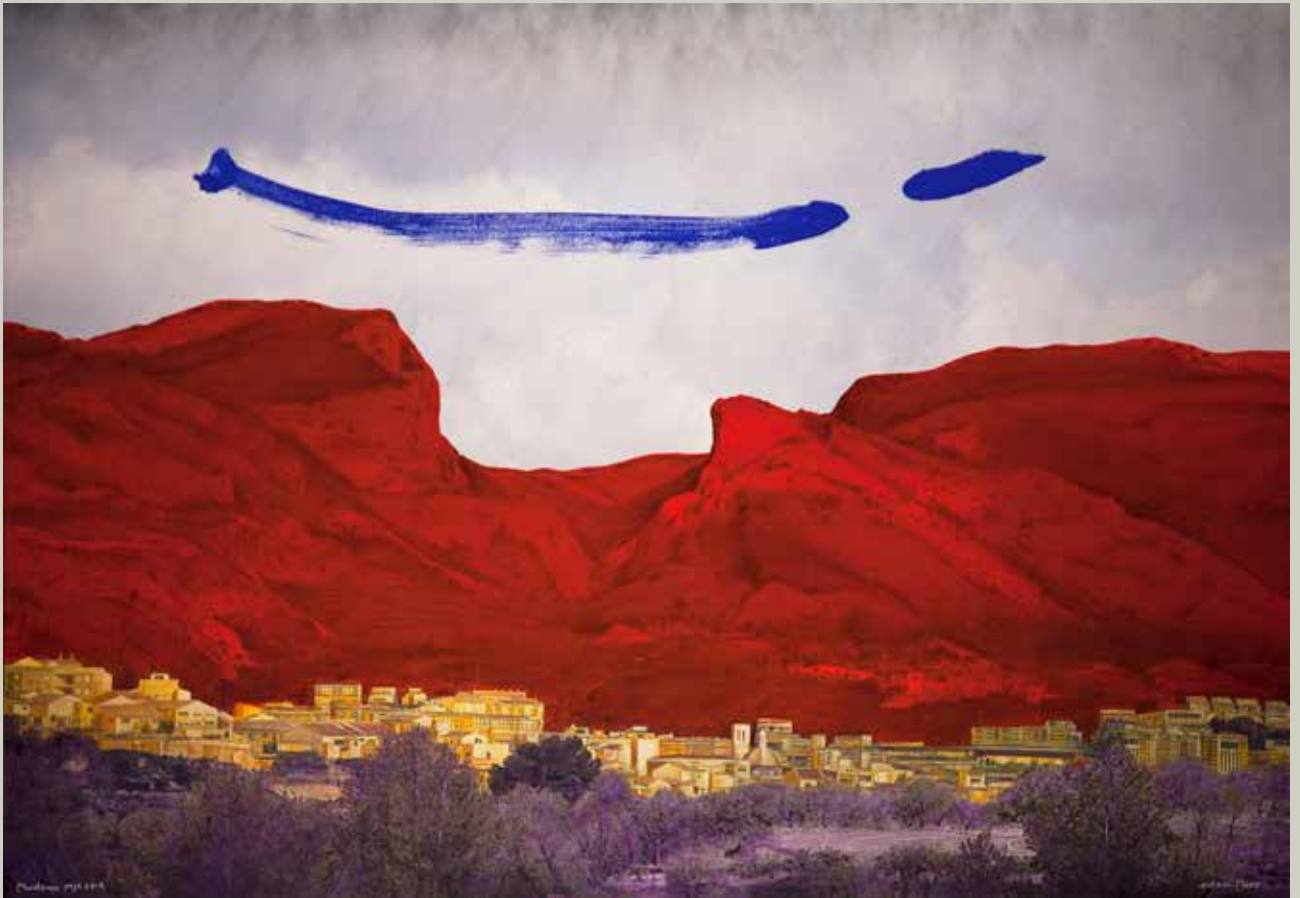
MUNTANYA ROJA 2015/ Alcoi (País Valencià) (Acrílic s/ llenç, 114x162)