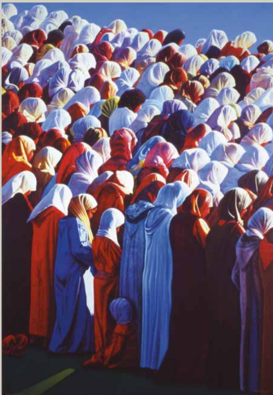
RAMADÀ 2007/ Melilla (Acrílic s/ llenç, 162x114)