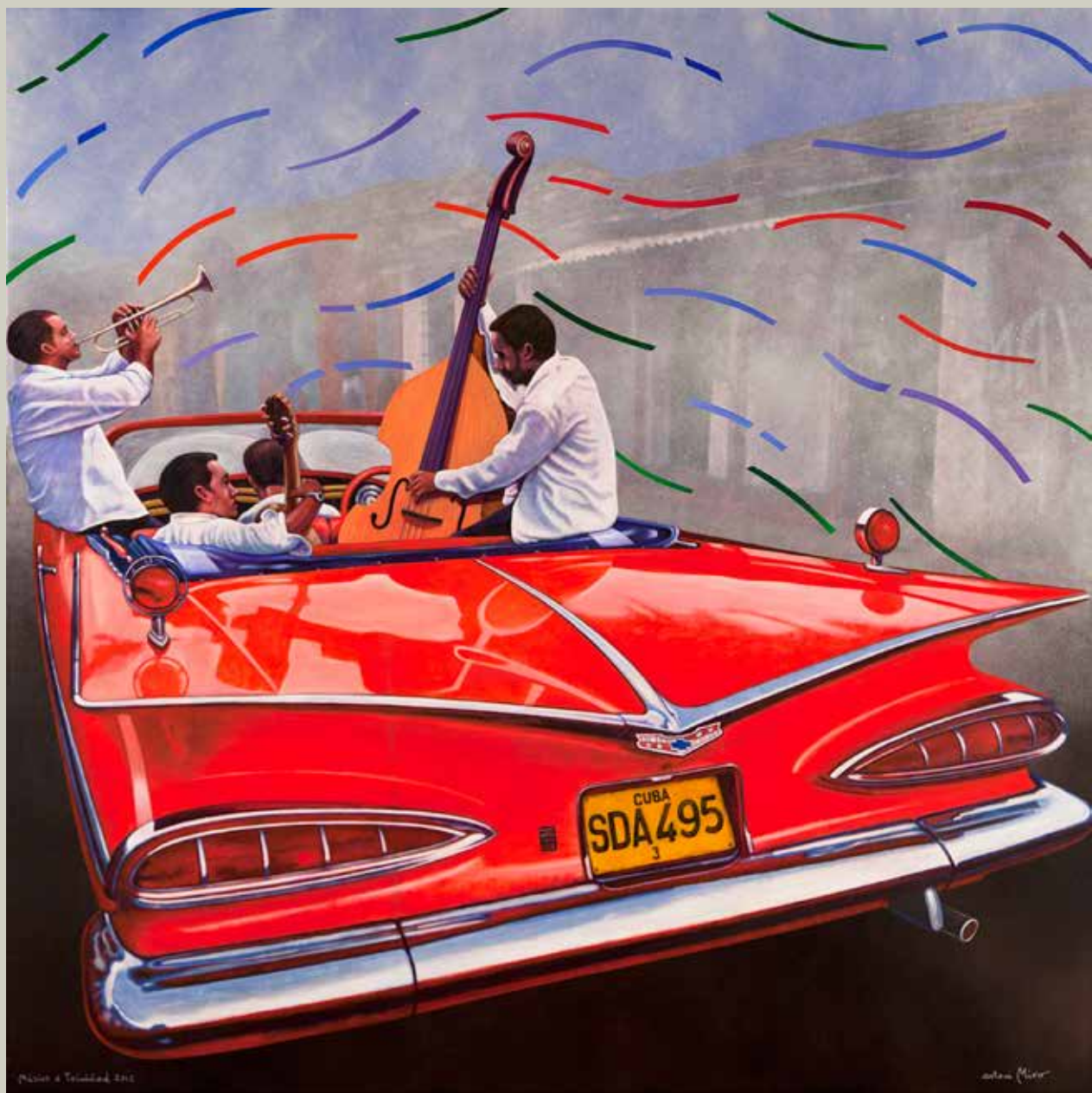
MÚSICS A TRINIDAD 2012/ Cuba (Acrílic s/ llenç, 116x116)