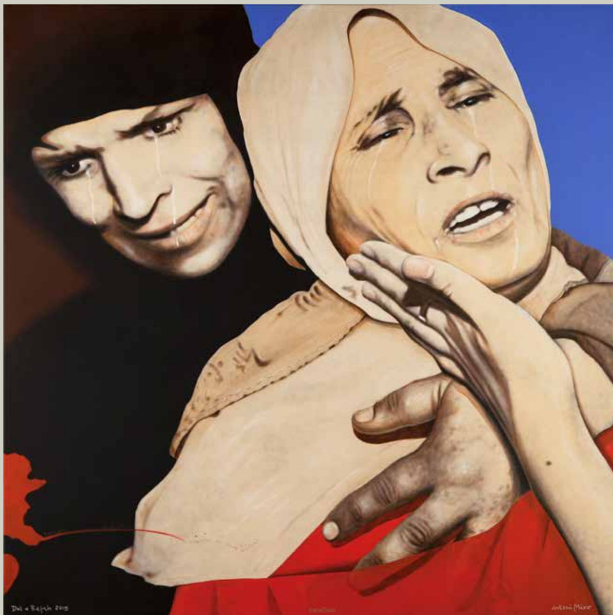
DOL A RAFAH 2015/ Palestina (Acrílic s/ llenç, 116x116)