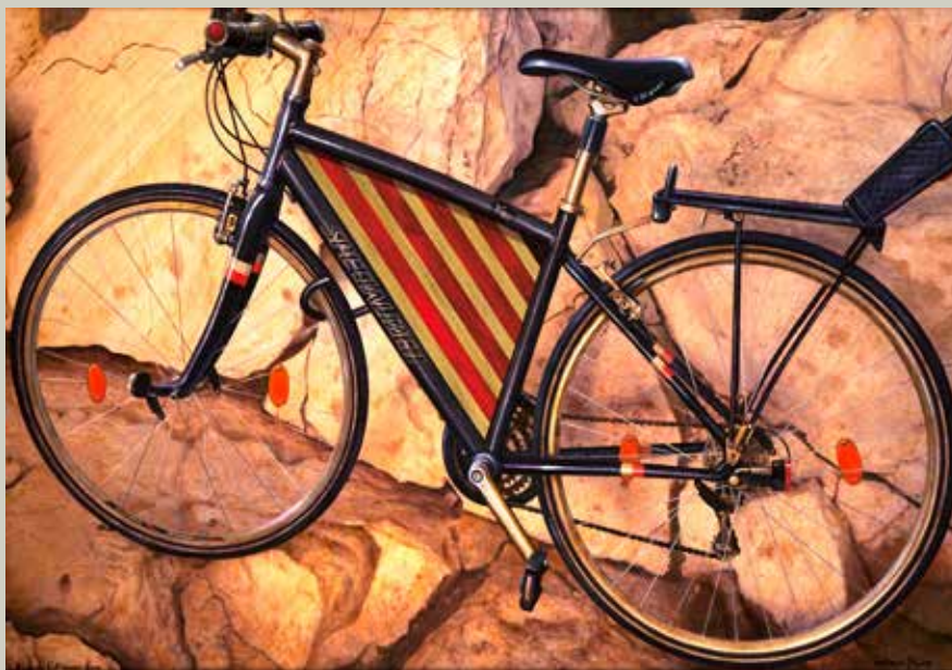
BICING 2010/ Barcelona (Acrílic s/ llenç, 65x92)