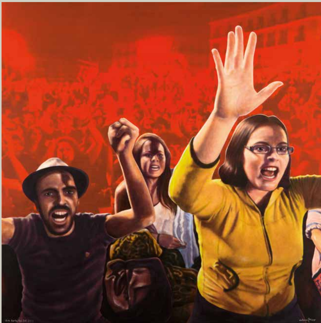
15 M PORTA DEL SOL. 2013/ Madrid (Acrílic s/ llenç, 116x116)