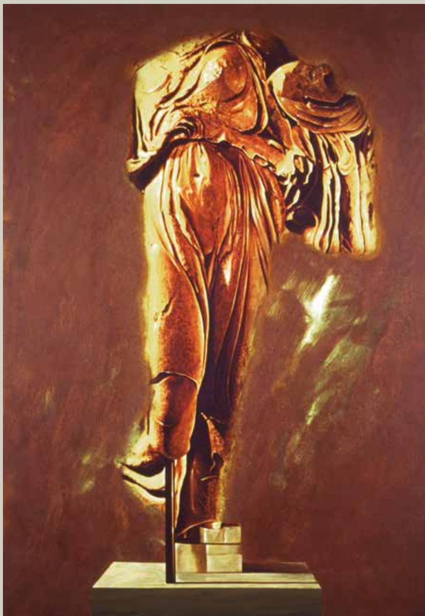
NIKE D'EPIDAURE 2007/ Atenes (Acrílic i metall s/ llengç, 162x114)