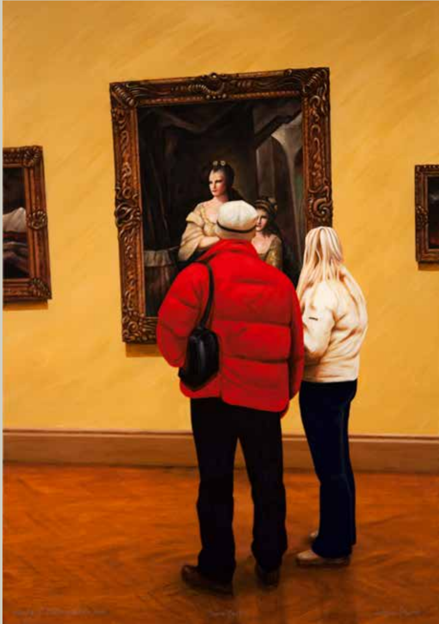
VISITA AL METROPOLITAN 2011/ Nova York (Acrílic s/ llenç, 92x65)