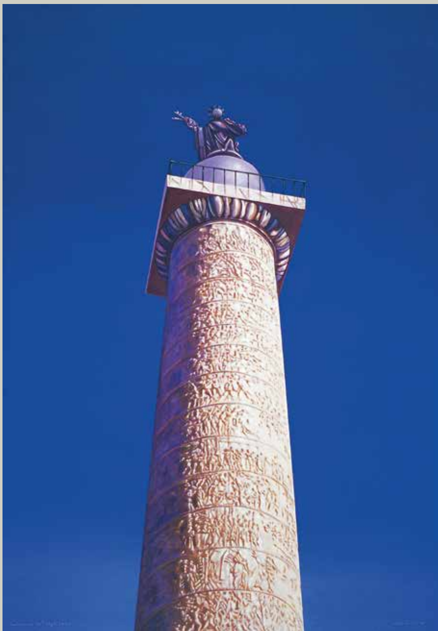
COLUMNA DE TRAJÀ 2004/ Roma (Acrílic s/ llenç, 116x81)