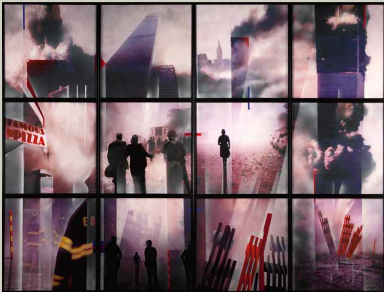
POLS BLANCA 2012/ Manhattan (Acrílic s/ llenç, Políptic 12 de 65x65)