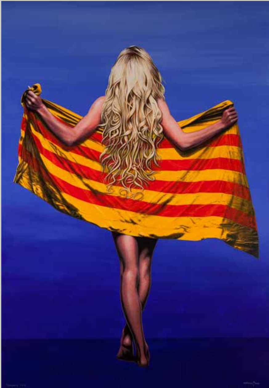
SENYERA 2012/ València (Acrílic s/ llenç, 162x114)