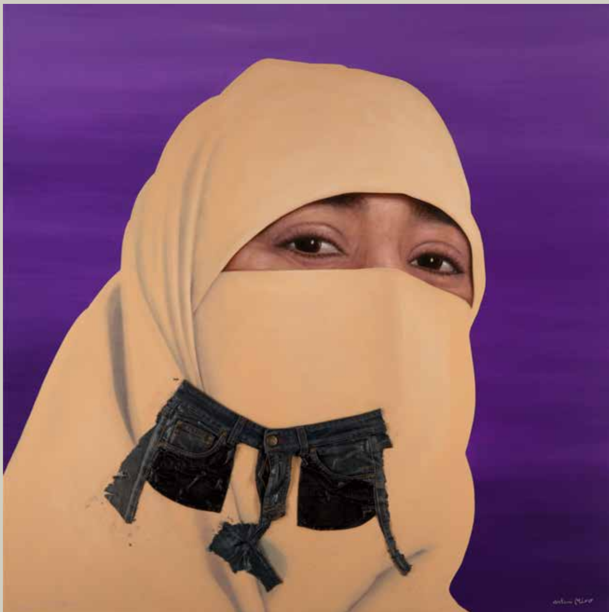
ZOHRA AMB NIQAB 2015/ El Vendrell (Acrílic i collage s/llenç, 116x116)