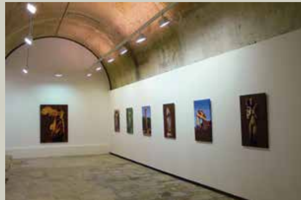
MUA, Univesitat d'Alacant 2010 Exposició a Seul, Corea 2004 Exposició a l'Havana, Cuba 2011