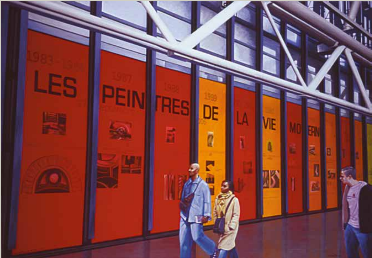
LES PEINTRES DE LA VIE 2007/ Paris (Acrílic s/ llenç, 114x162)