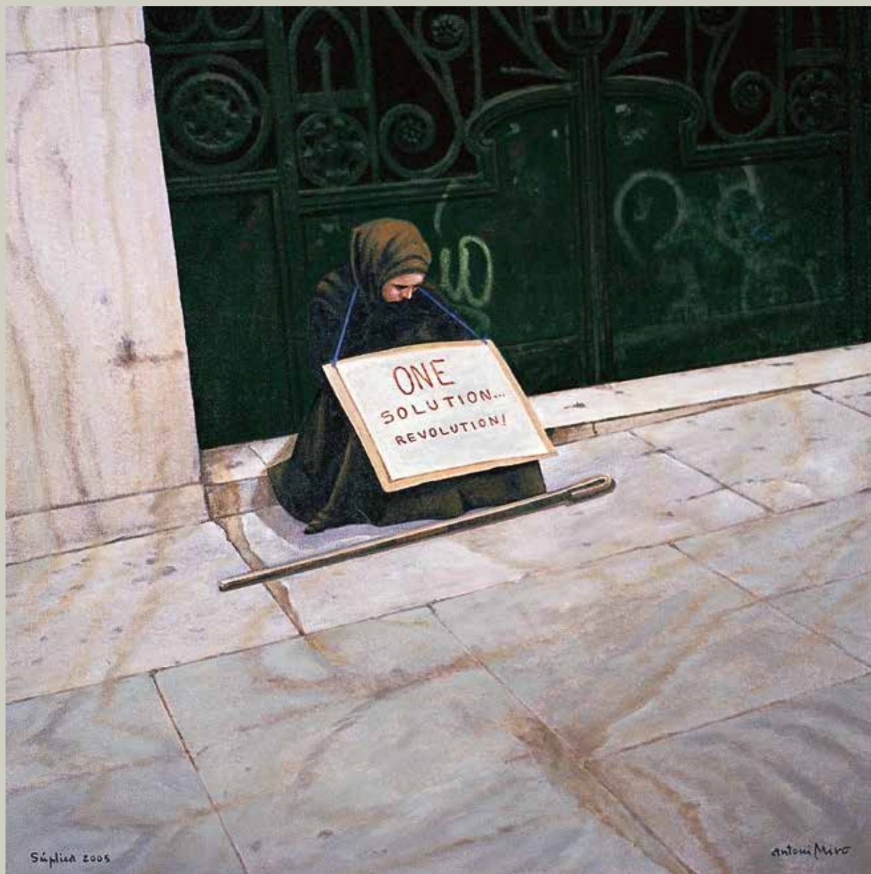
SÚPLICA 2005/ Madrid (Acrílic s/ llenç, 65x65)