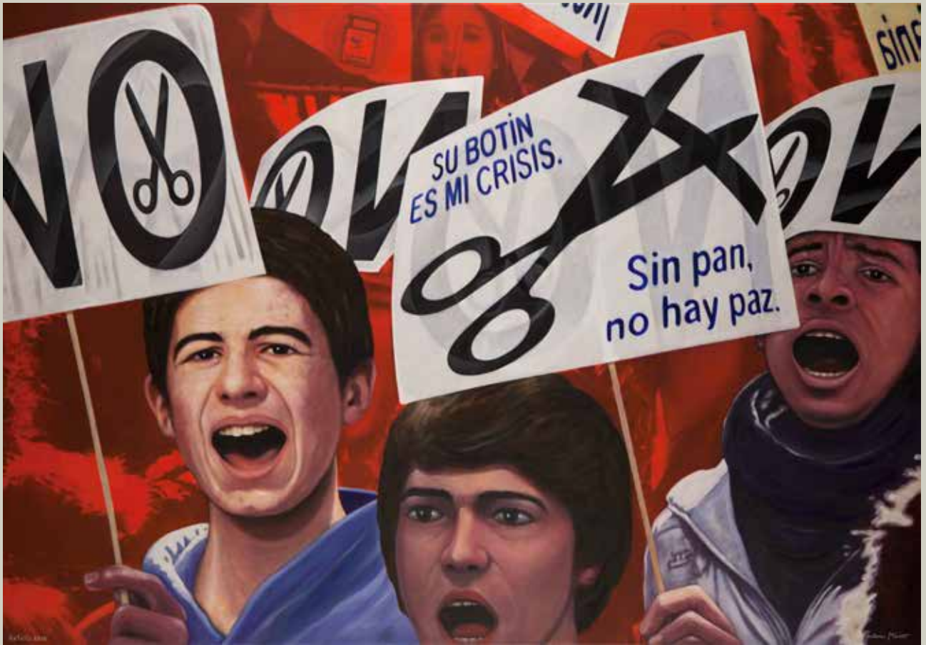
RETALLS 2015/ Madrid (Acrílic s/ llenç, 114x162)