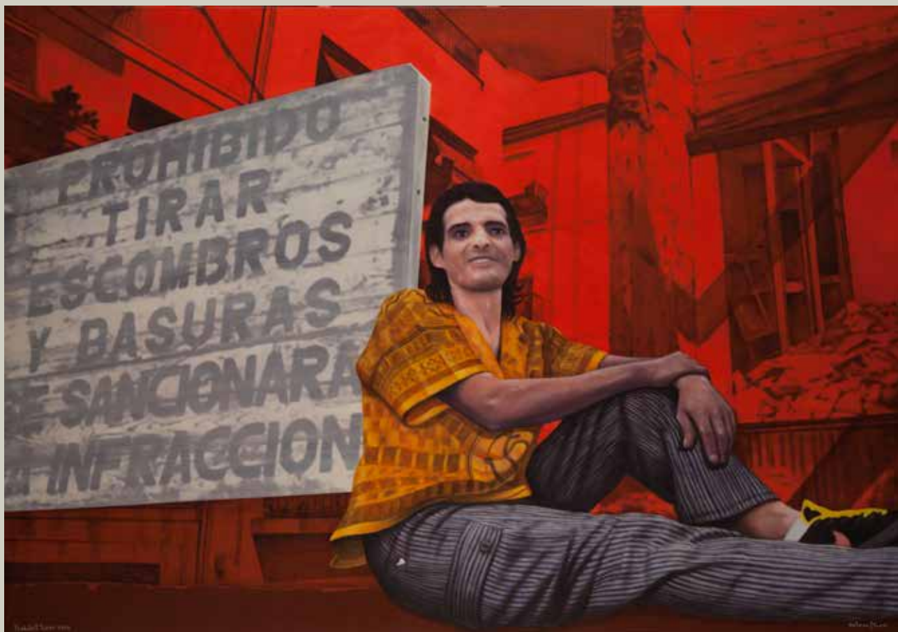
PROHIBIT "TIRAR" 2014/ València (Acrílic s/ llenç, 114x162)