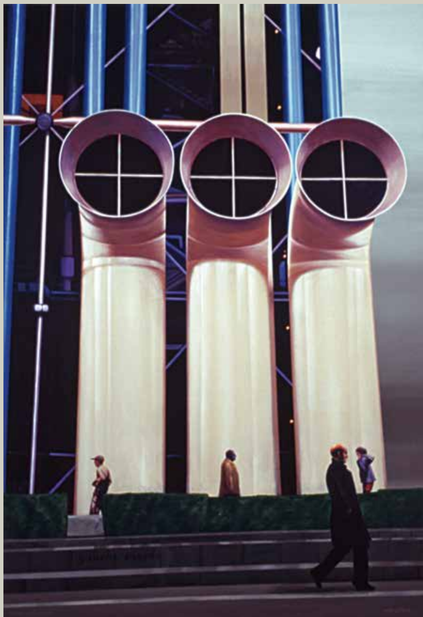
POMPIDOU RESPIRA 2007/ Paris (Acrílic s/ llenç, 116x81)