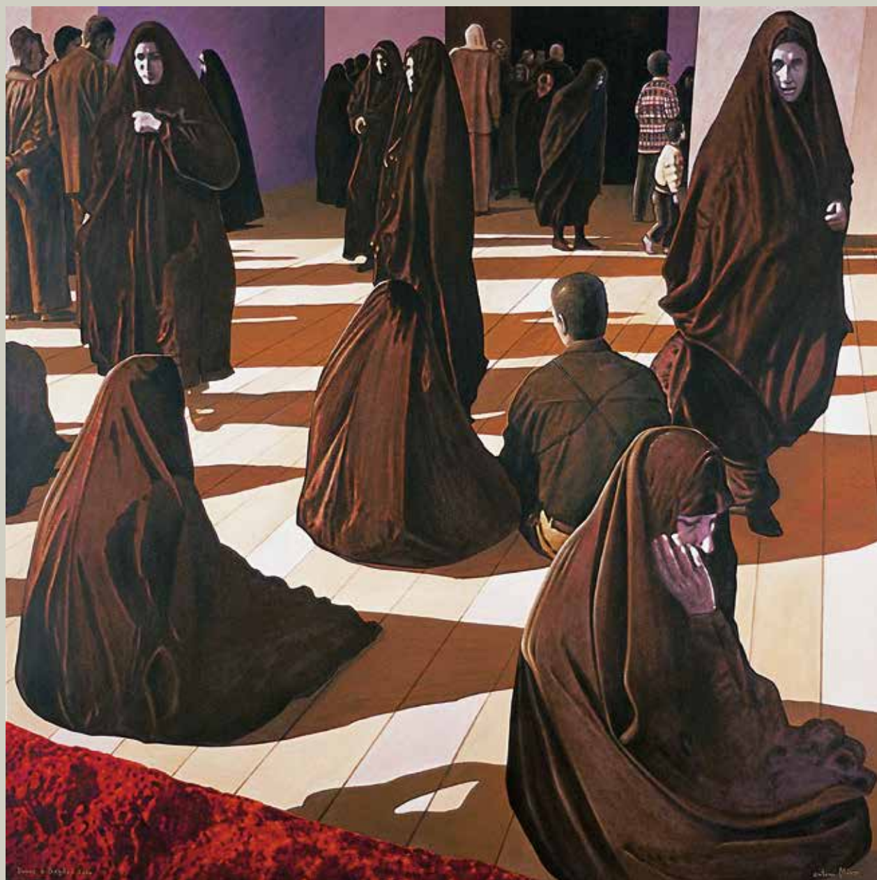
DONES A BAGDAD 2004/ L'Iraq (Acrílic s/ llenç, 116x116)