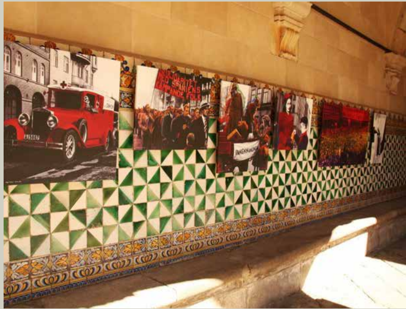
Institut d'Estudis Catalans, Barcelona 2015

En resum, si la seua pintura és una pintura de conscienciament, no és menys cert que en el seu procés creatiu s'inclou un destacat grau de conscienciament de la pintura, on diverses experiències, tècniques, estratègies i recursos s'uneixen per a constituir el seu particular llenguatge plàstic, que no s'esgota en ser un mitjà per a la comunicació ideològica, sinó que, de manera paral·lela, es constitueix en registre d'una comunicació estètica evident.