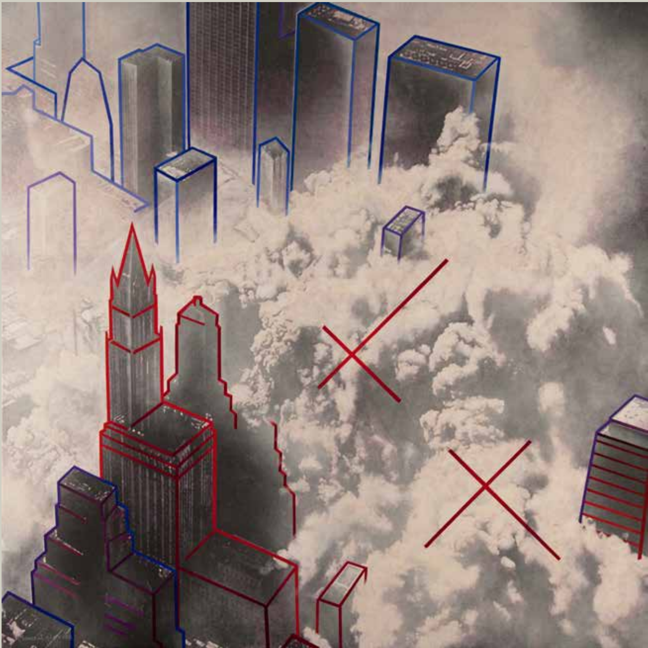
MOMENT CLAU 2012/ Manhattan NY (Acrilic s/ llenç, 116x116)