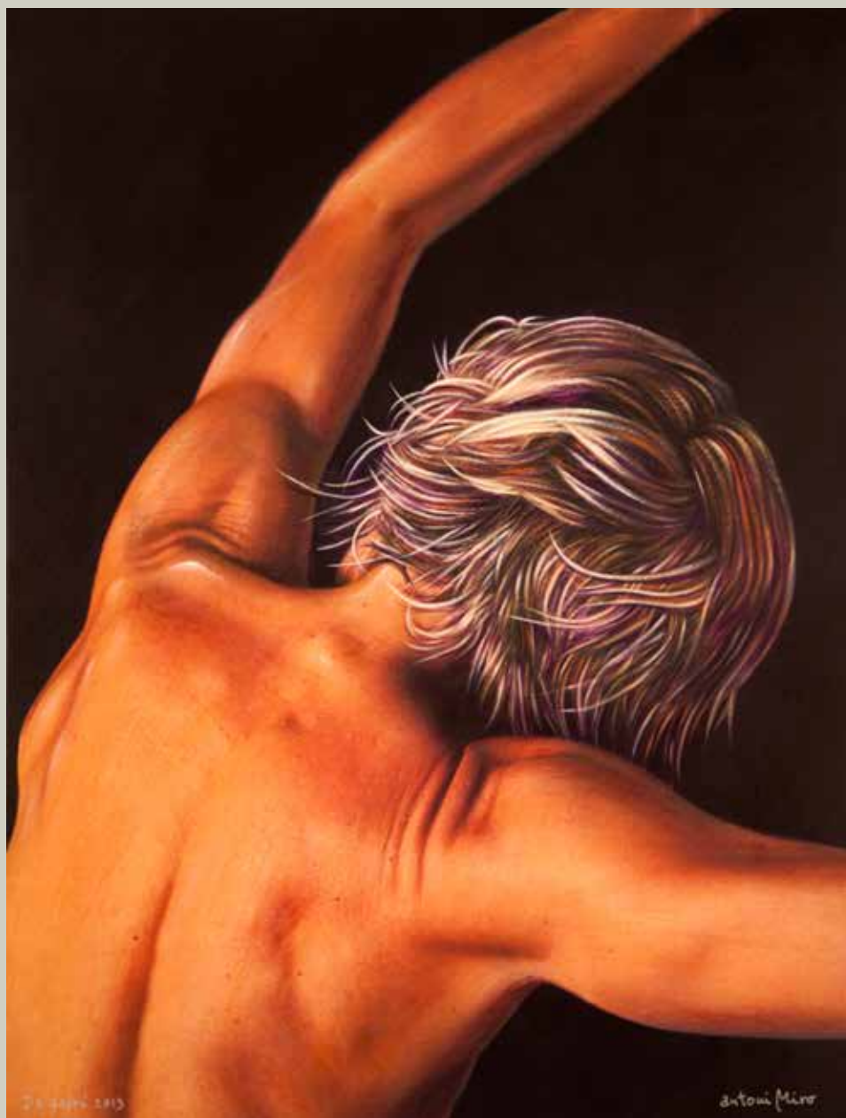
DE GAIRÓ 2013/ Alcoi-Barcelona (Acrílic s/ llenç, 65x50)