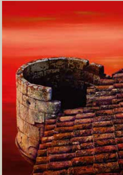
VICTÒRIA AL LOUVRE 2010/ Paris (Acrílic s/ llenç, 162x114)