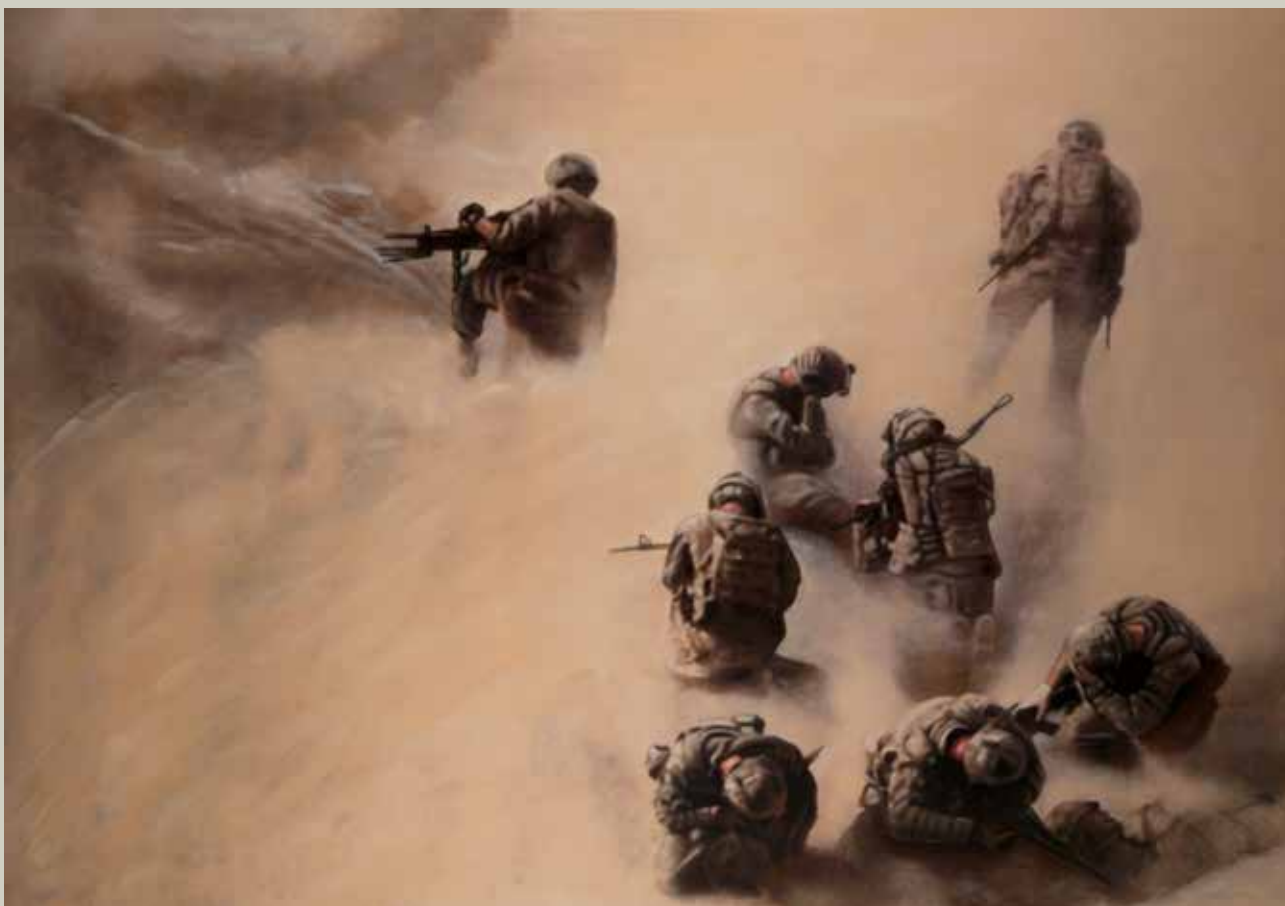
RETIRADA 2014/ Afganistan (Acrílic s/ llenç, 114x162)