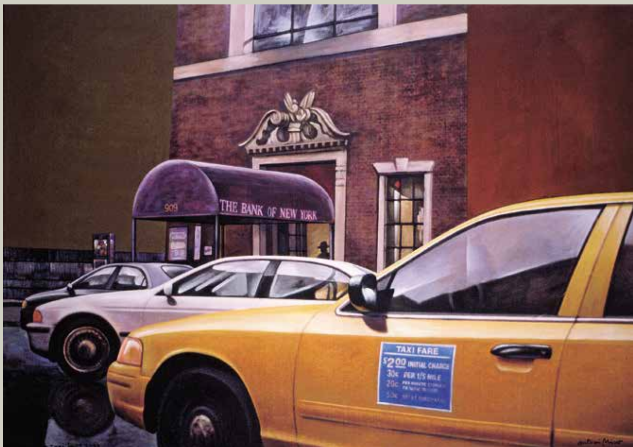
TAXI FARE 2003/ Nova York (Acrílic i metall s/ llenç, 65X92)