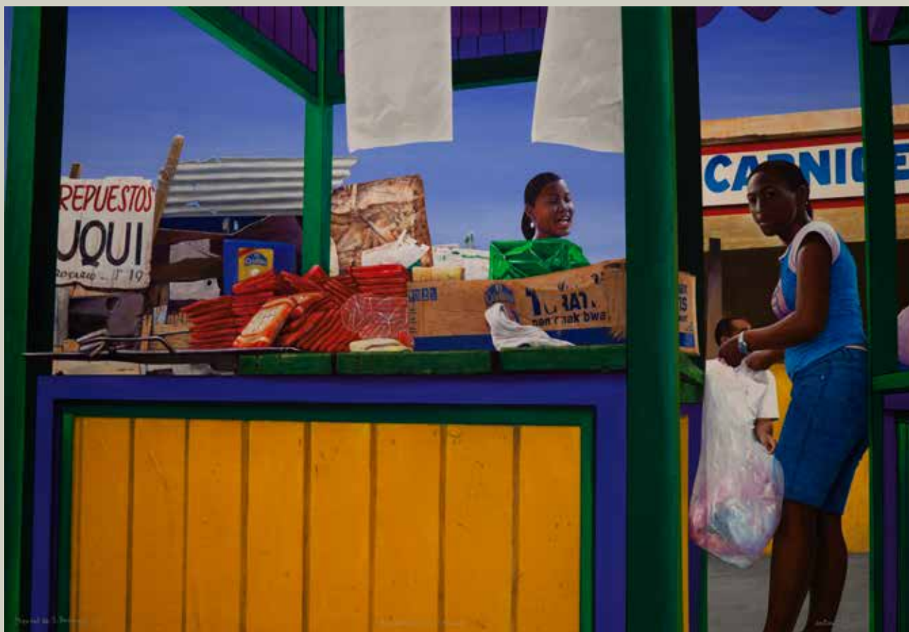
MERCAT DE S. DOMINGO 2011/ Republica Dominicana (Acrílic s/ llenç, 81x116)