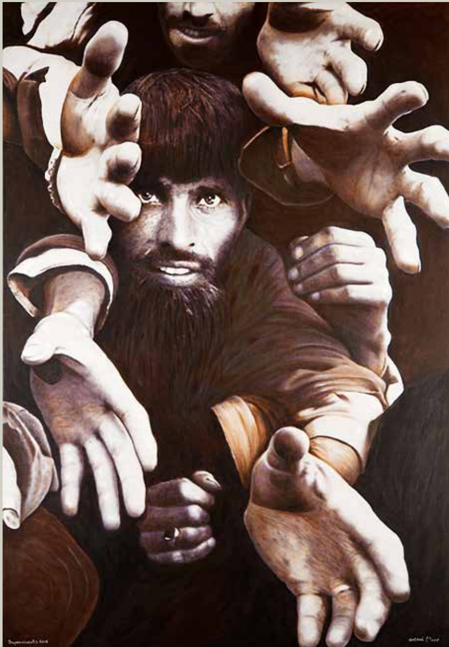
SUPERVIVENTS 2015/ Uri-Casimira, India (Acrilic s/ llenç, 162x114)