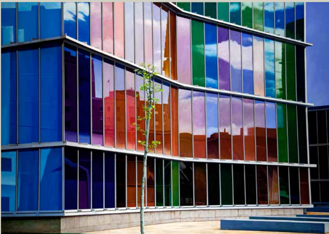
MUSAC DE LEÓN 2009/ Lleó (Acrílic s/ llenç, 114x162)