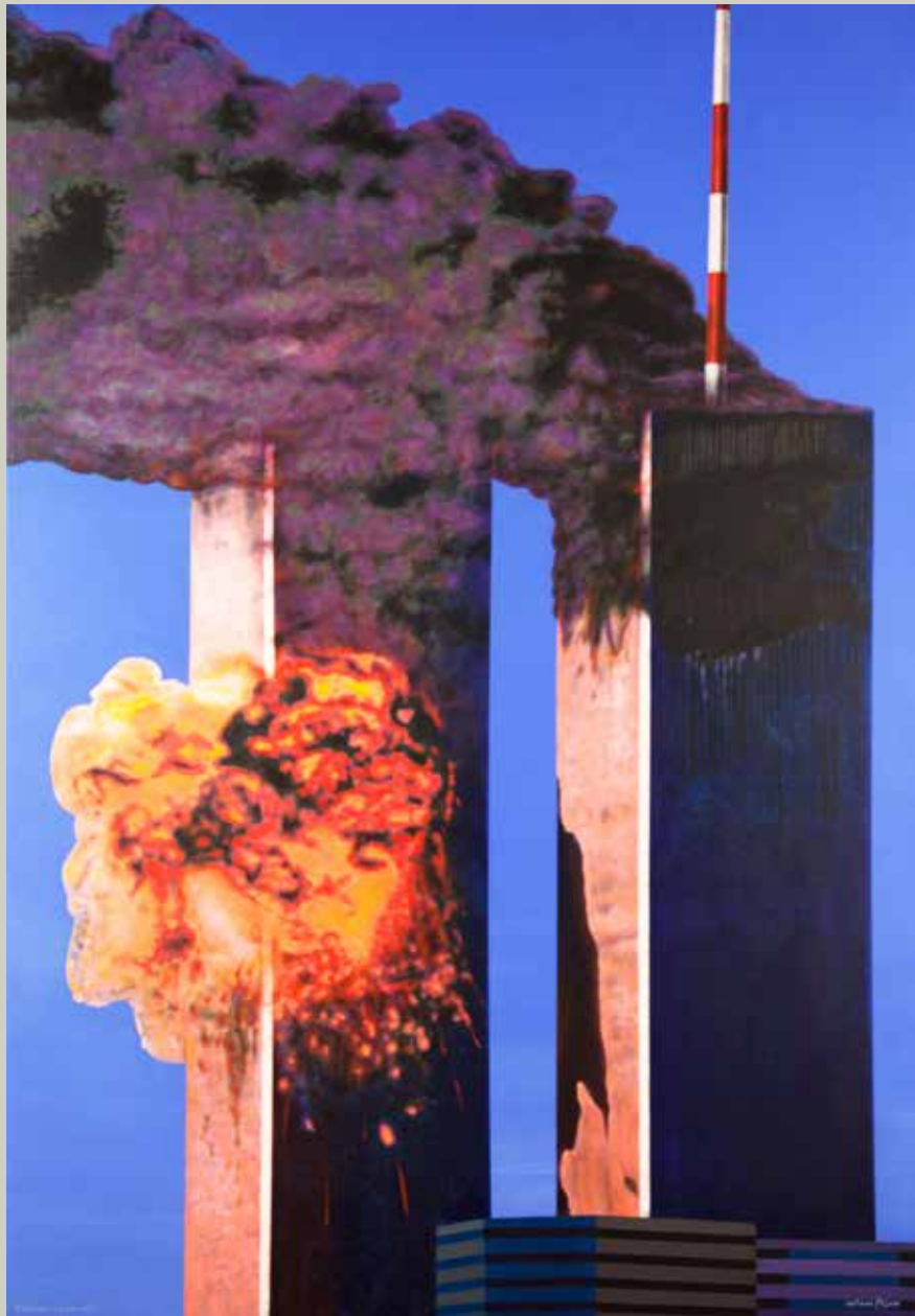
FLAMES I FUM 2012/ Manhattan (Acrilic s/ llenç, 162x114)