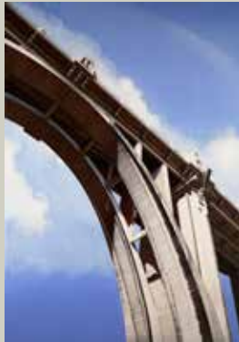
MIG ARC 2015/ Alcoi (Acrílic s/ llenç, 162x114)

2 0 1 5 CASA MUNICIPAL DE CULTURA “JOSÉ CANDELA LLEDÓ”