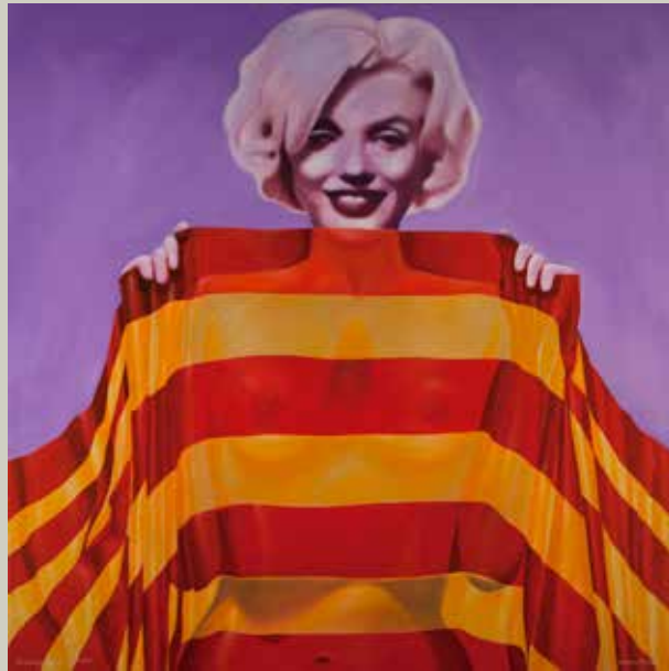
MARILYN A VALÈNCIA 2015/ País Valencià (Acrílic s/ llenç, 116x116)