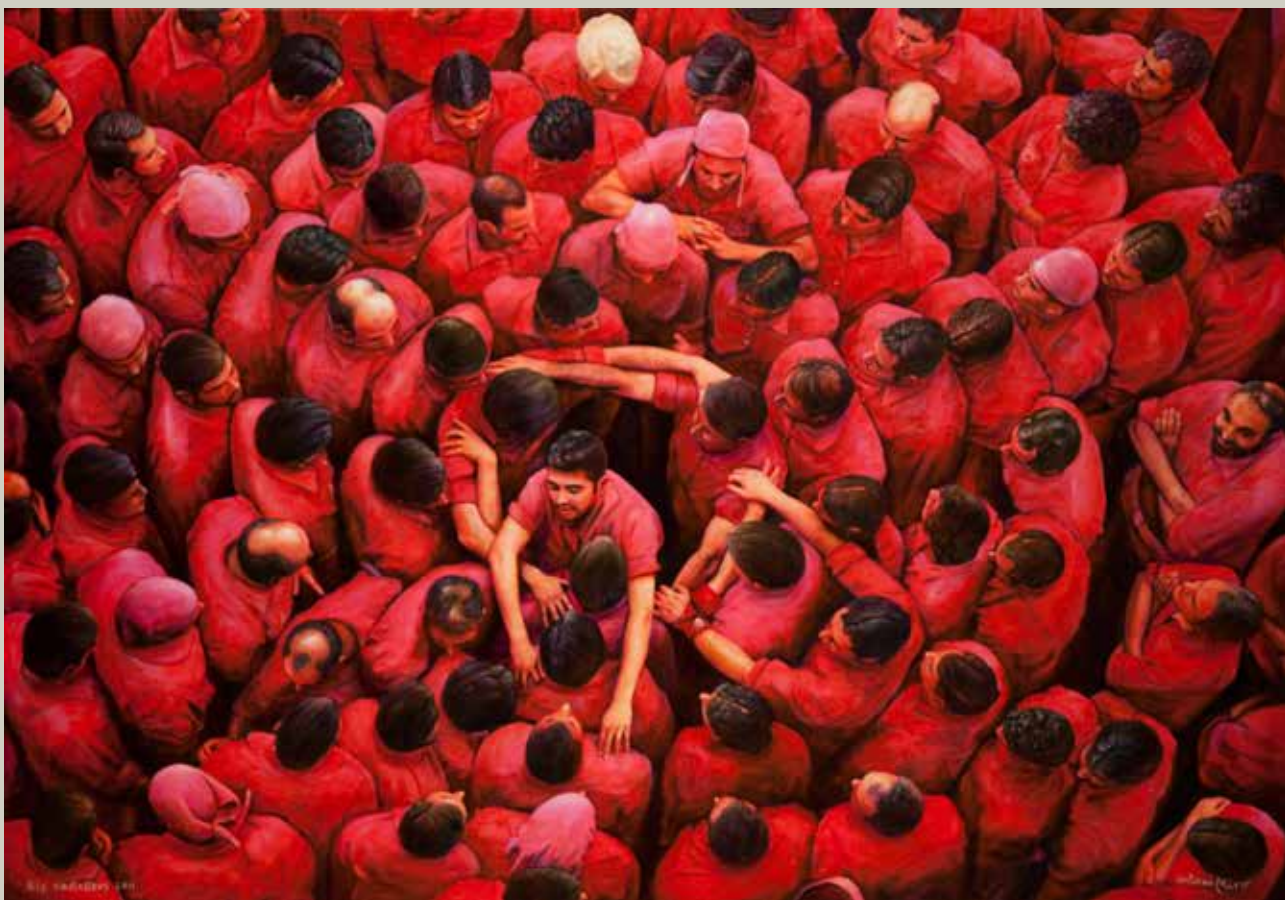
ELS CASTELLERS 2011/ Valls (Acrílic s/ llenç, 81x116)