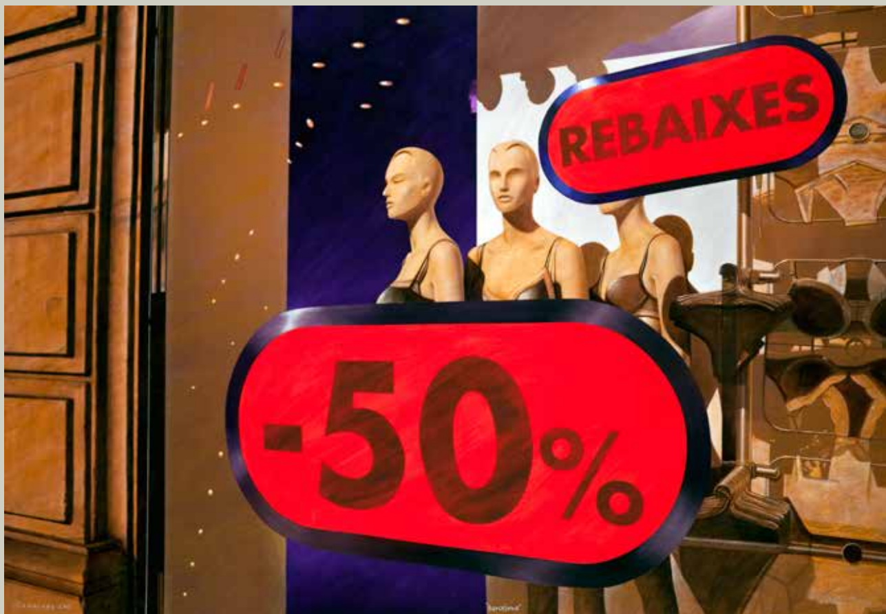
REBAIXES 2011/ Barcelona (Acrílic s/ llenç, 81x116)