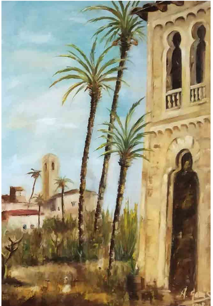
Fachada Casa de les Persianes, 2018 Mixta sobre tabla 100 x 80 cm