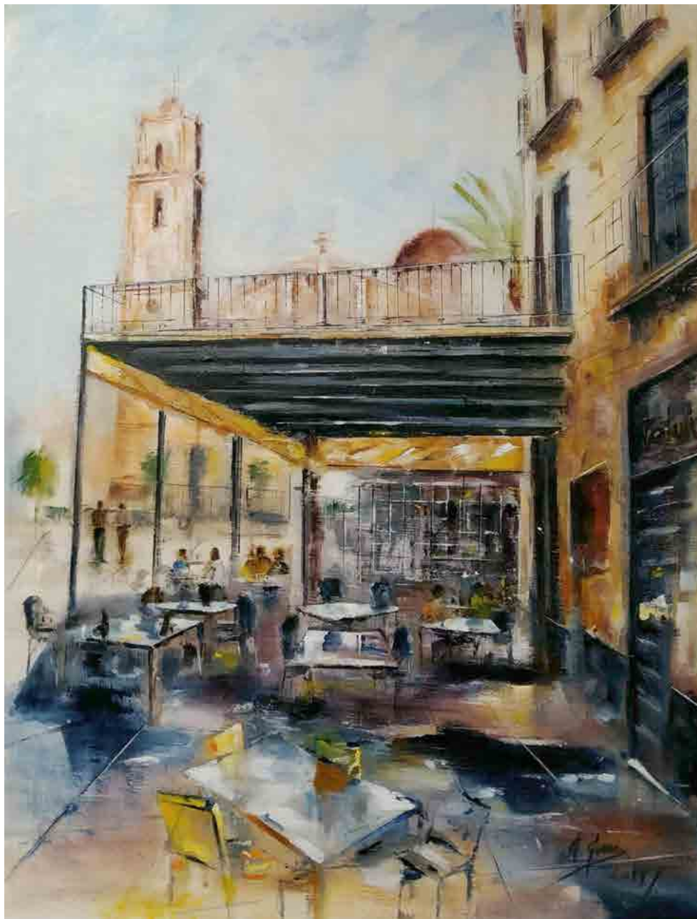
Plaza Constitución, 2019 Mixta sobre tabla 100 x 80 cm