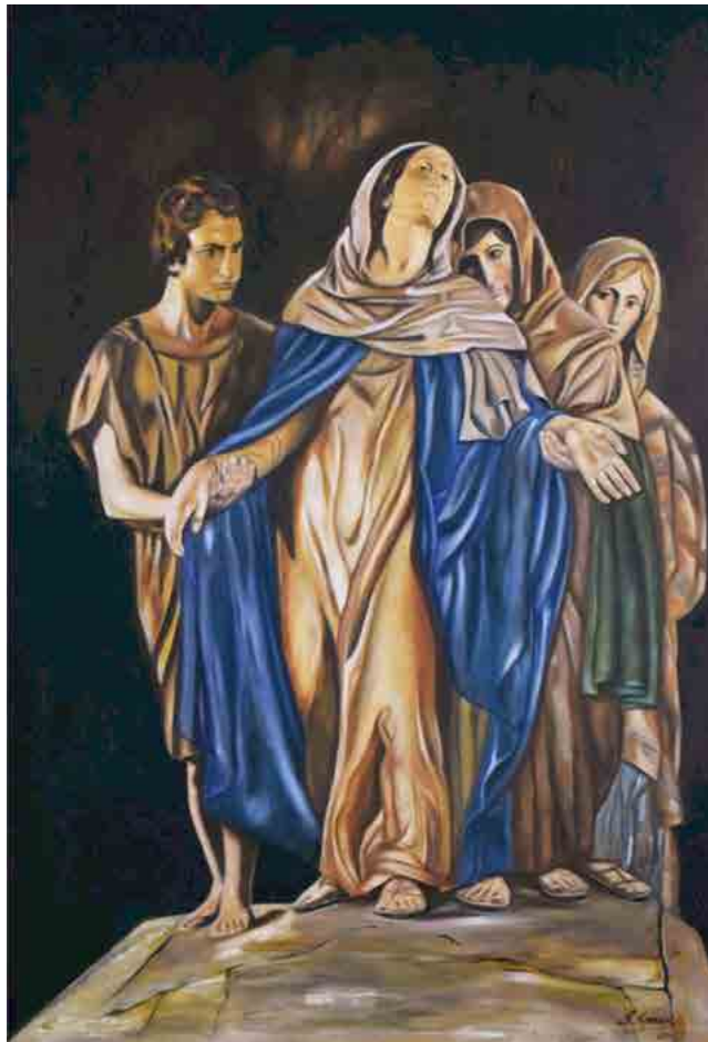
Las 3 Marías y San Juan, 2014 Óleo sobre lino 180 x 150 cm