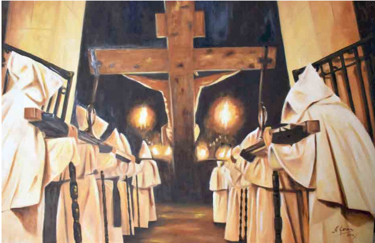
Procesión penitentes, 2013 Óleo sobre tabla 160 x 140 cm