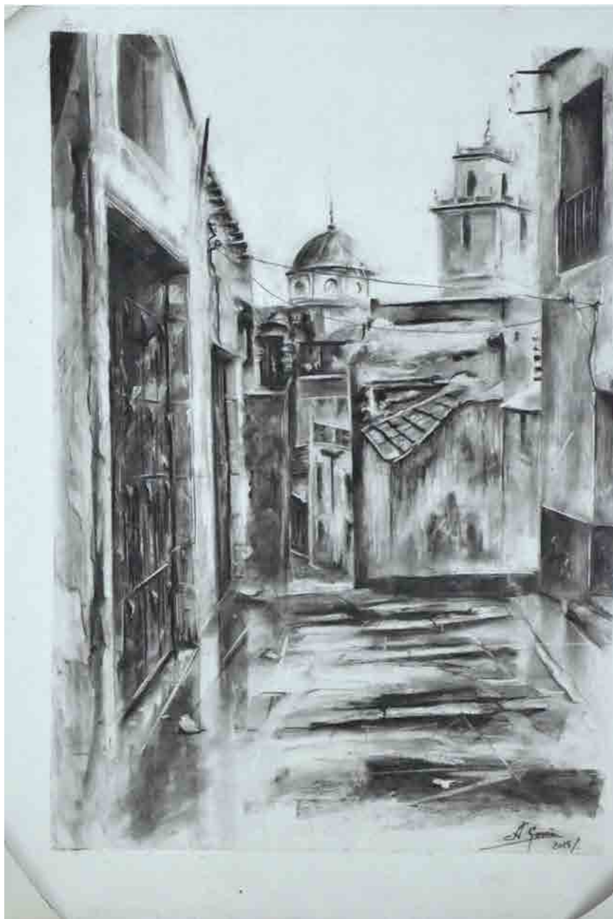
Calle Chacón, 2019 Mixta sobre tabla 60 x 80 cm