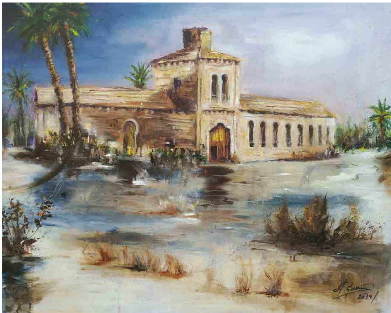
Casa de les Persianes, 2018 Mixta sobre tabla 80 x 60 cm