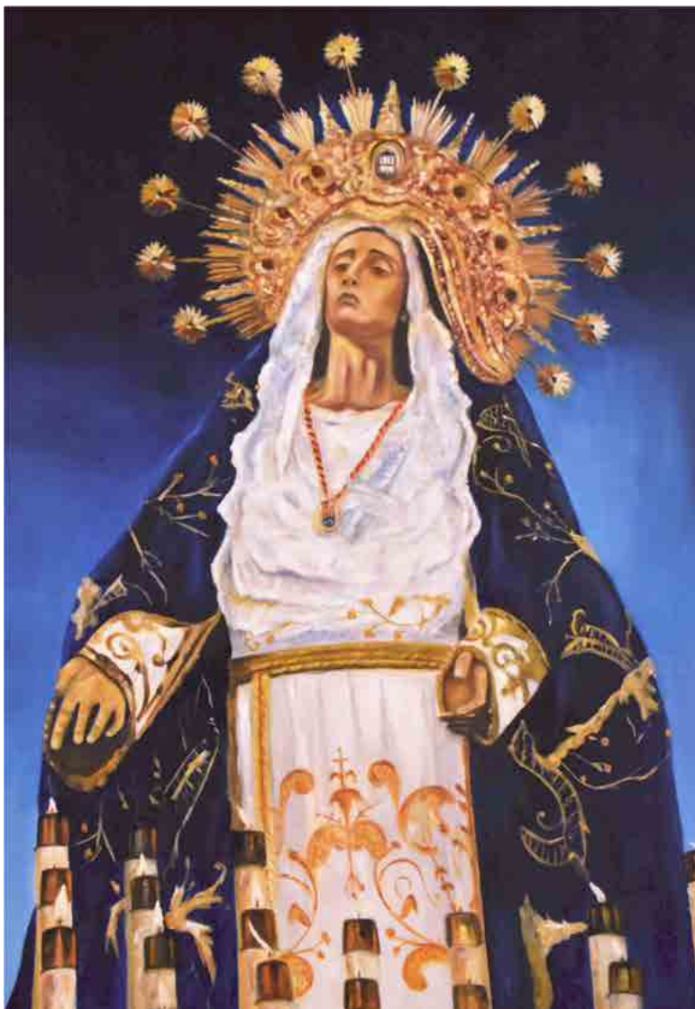
La Dolorosa, 2015 Óleo sobre lino 180 x 140 cm