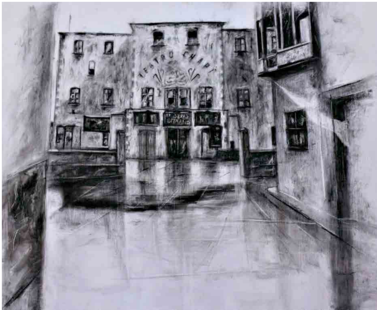
Teatro Chapí, 2023 Mixta sobre tabla 120 x 80 cm