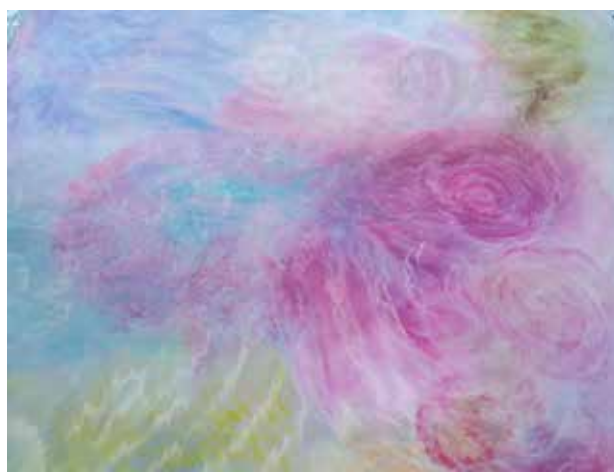
Sin título ceras sobre lienzo 80 x 100 cm