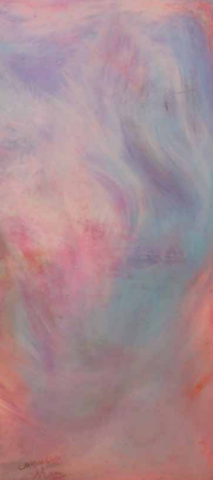
Marea volcánica Ceras sobre cartón 112 x 82 cm