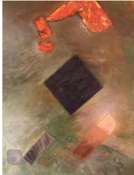
La fuerza del deporte óleo sobre lienzo 80 x 100 cm