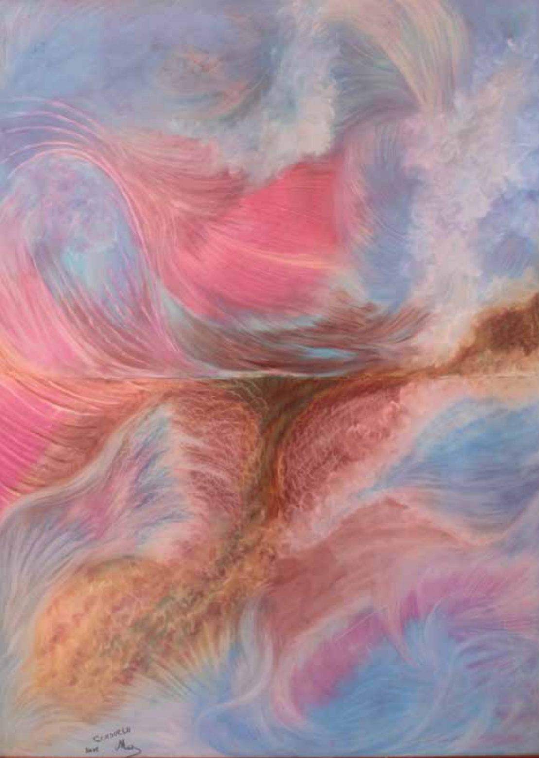
Una pequeña brisa Ceras sobre cartón 117 x 87 cm