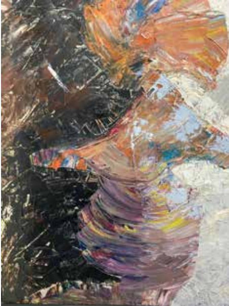
Jarrón de fantasía óleo sobre lienzo 80 x 100 cm