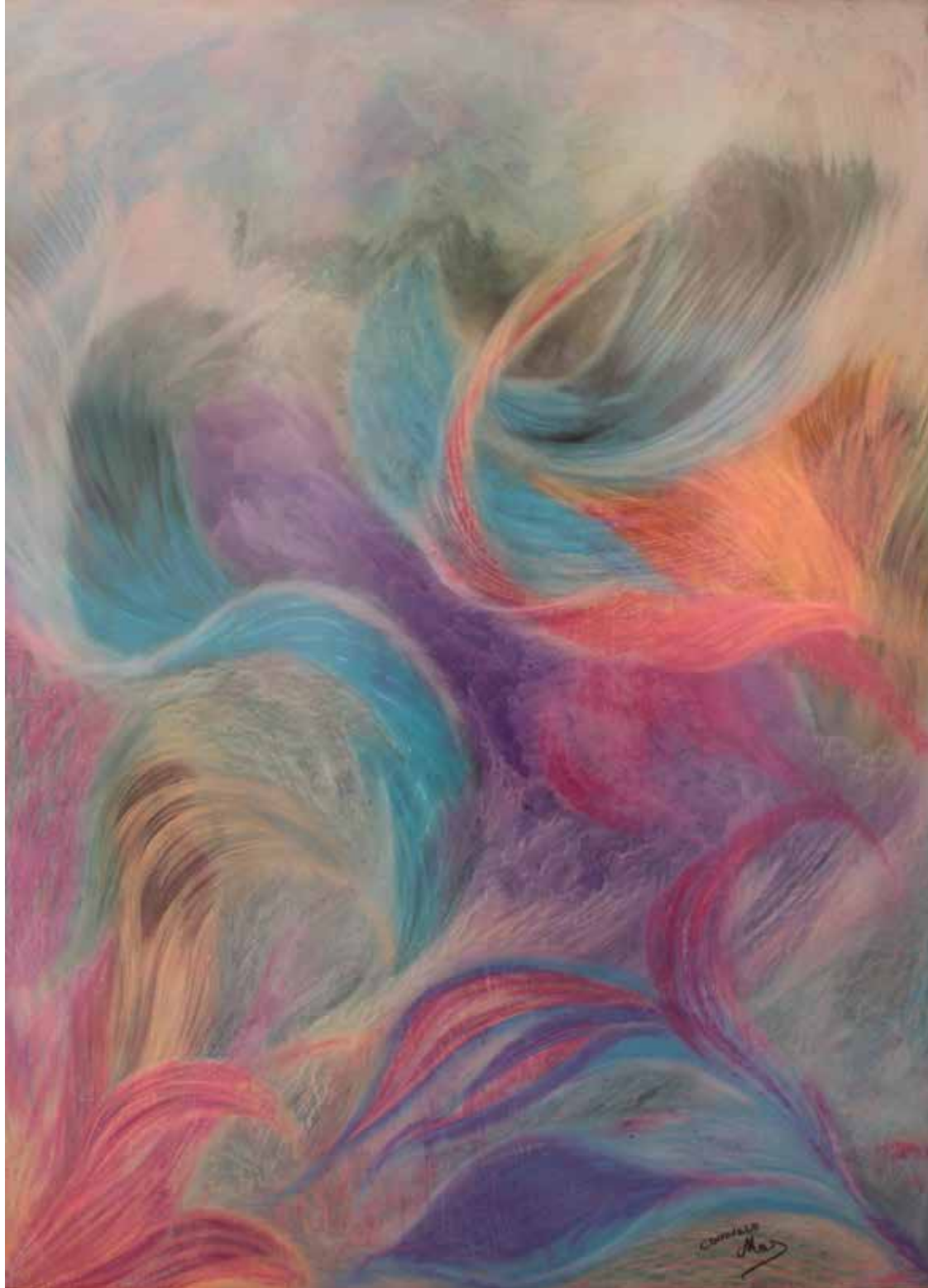
Escapada Ceras sobre cartón 89 x 122 cm