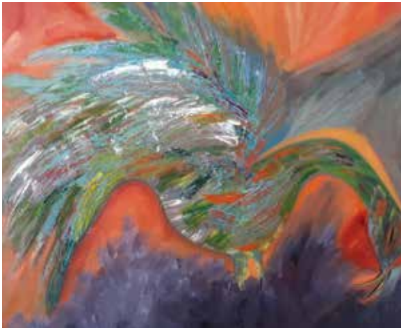
El gallo óleo sobre lienzo 80 x 100 cm