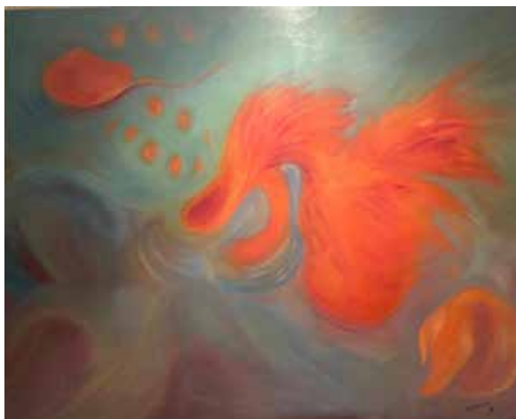
Remolino en la mar óleo sobre lienzo 80 x 100 cm