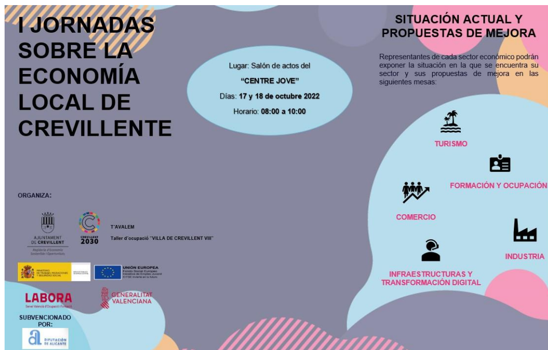
Fotografía 1. Cartelería utilizada para publicitar las jornadas.