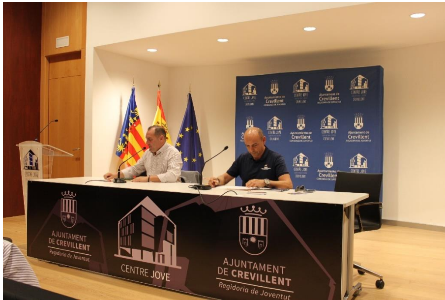
Fotografía 7. Mesa de infraestructuras y transformación digital.