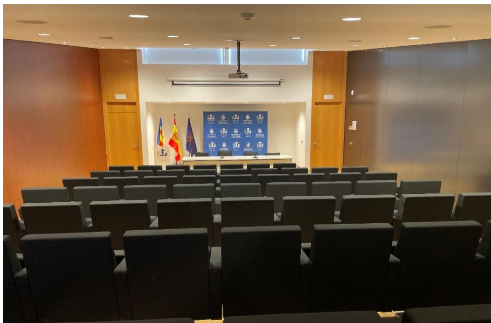
Fotografía 2. Salón de actos del Centre Jove “Juan Antonio Cebrián” de Crevillent.