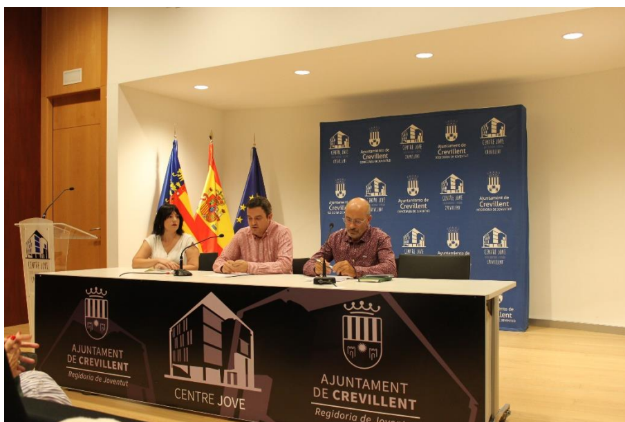
Fotografía 5. Mesa de turismo.

Para hablar sobre el turismo de Crevillent asistieron los siguientes ponentes: