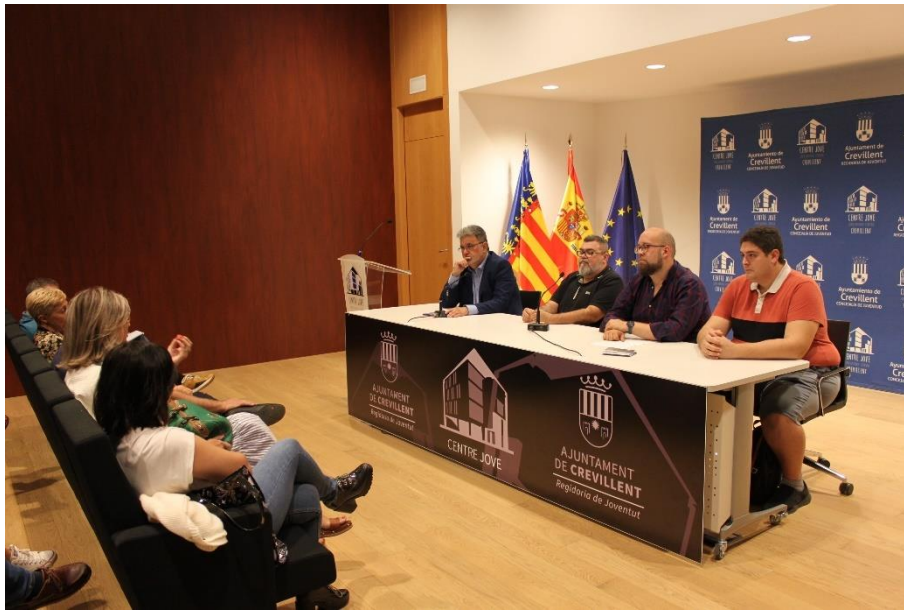
Fotografía 6. Mesa de comercio.

Fue momento de debate entre los asistentes y los participantes el estado actual del Mercado de Abastos de Crevillent, momento en que el concejal intervino para que los presentes imaginaran el mercado de abastos con un cambio de concepto como tienen otros municipios; con zonas de restauración, diferentes horarios, con un edificio más atractivo, definitivamente en el que los ciudadanos del municipio lo entiendan, no solo como un lugar de venta de producto, sino también como un lugar de ocio.