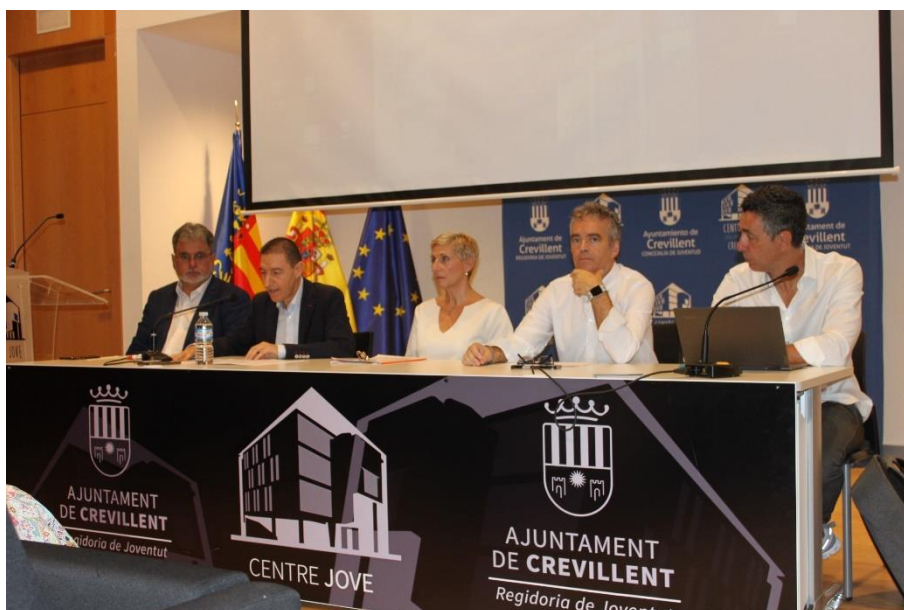
Fotografía 8. Mesa de industria.