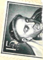
Típ.-Lit. Coullaur-Merwano, 49.-Madrid.